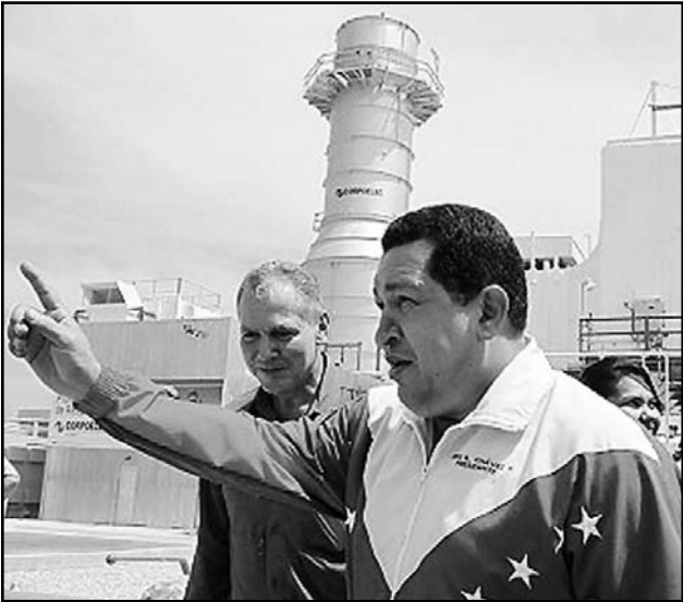
La planta que inauguró Chávez favorecerá a 30 000 familias con la generación de 150 megavatios.

CARACAS, 2 de septiembre. —El presidente de Venezuela, Hugo Chávez, acusó este jueves a Estados Unidos de financiar a la oposición de su país para propiciar acciones desestabilizadoras que deriven en un golpe de Estado.