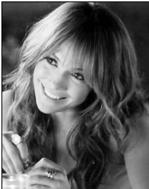
Jennifer López en Plan B.

En el Multicine Infanta así como en el Payret, Alameda, Lido, Ambassador, Regla y Continental, se exhibe el filme norteamericano de terror Los locos , de Breck Eisner, con Radha Mitchell, Timothy Olyphant y Joe Anderson. Una pequeña ciudad se ve sacudida por el impacto de una bomba biológica que transformará a