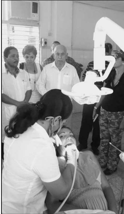
Es necesario aprovechar mejor los conocimientos de los especialistas de la salud, señaló Machado Ventura.

En intercambios con trabajadores del policlínico Genaro Brito, de Campechuela, y del hospital Comandante Félix Lugones, de Pilón, llamó a aprovechar