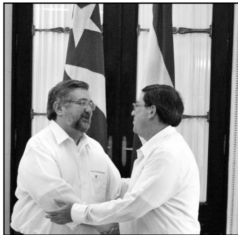
Ambos cancilleres sostuvieron un diálogo fraternal en La Habana.