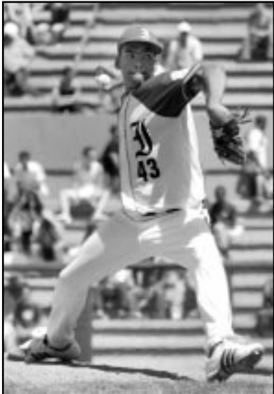
Odrisamer lo hizo bien durante seis capítulos.

equipos japoneses, como parte de su preparación antes de competir en el V Mundial de esa categoría, según reportes recibidos desde la capital nipona.