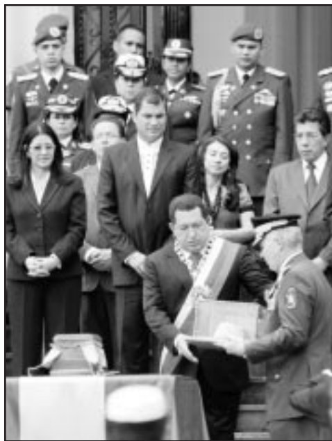
El presidente Hugo Chávez recibe los restos simbólicos de la heroína Manuela Sáenz.

capital en visita oficial para celebrar además el octavo encuentro presidencial Quito-Caracas.