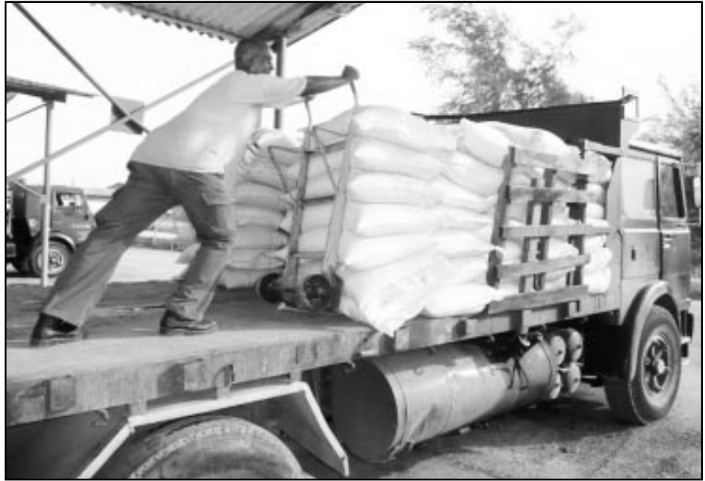
La buena planificación de las cargas resulta vital en la reorganización del transporte.

Las cifras no mienten. De mayo del 2009 a la fecha, las bases municipales, de un plan de ahorro de 1 792,4 toneladas, economizaron 2 053,1, es decir, dejaron de consumir 260,7 por encima de lo planifica-