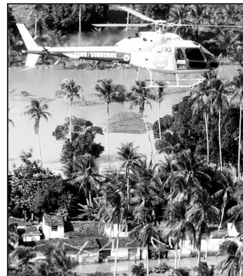
En Brasil las inundaciones ya causaron 1 000 desaparecidos y la evacuación de 65 000 personas. Foto: Reuters

Medios de prensa israelíes dijeron que la alta resolución de las cámaras del satélite, permitirían a Israel mantener fuertemente vigilado a su archienemigo Irán. (Reuters)