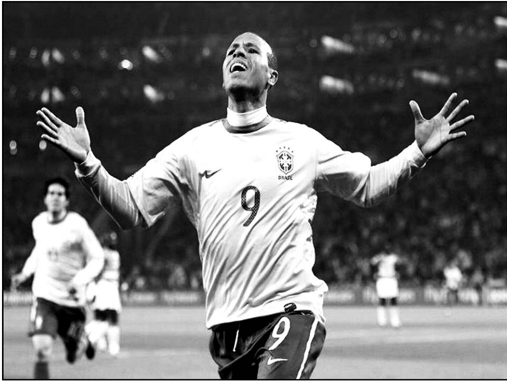
El ariete condujo a la canarinha a los octavos de final.