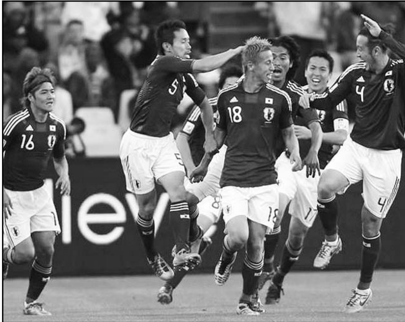
Keisuke Honda, doble satisfacción, gol y victoria tras su cumpleaños 24.

Justo reconocer que entre esos dos viejos conocidos (su primer duelo data de los Juegos Olímpicos de 1912) casi todo está dicho sobre la grama. La paridad