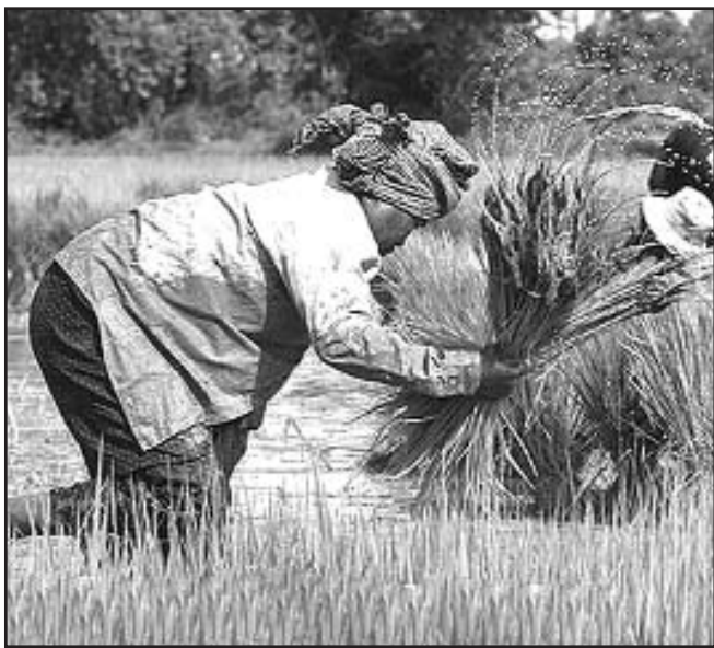
La SFI impulsa a modificar las legislaciones locales para facilitar la compra por parte de grupos empresariales privados del Primer Mundo.

MAPUTO, 14 de junio. — El Banco Mundial (BM) favorece la apropiación de tierras africanas por parte de empresas extranjeras para que estas las dediquen al jugoso negocio de los biocombustibles, según un informe que acaba de publicar un centro de investigación estadounidense, refiere Cubadebate.