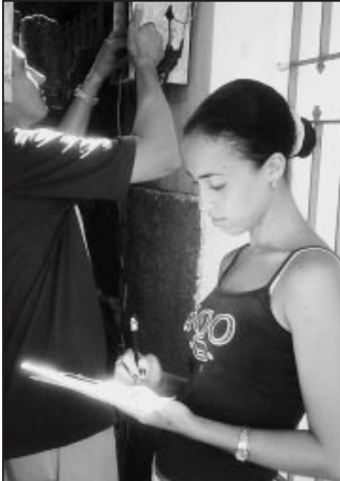
El sector residencial consume el 50% de la energía eléctrica del país.

La especialista reiteró la necesidad de que los organismos cumplan las cifras convenidas con los consejos energéticos a todos los niveles, sin afectar la producción y