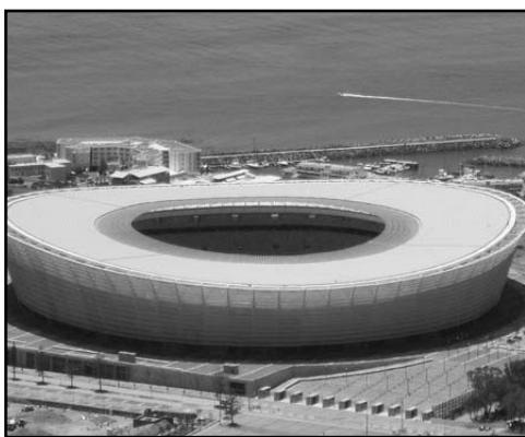
Green Point Ciudad: Ciudad del Cabo Capacidad: 70 000