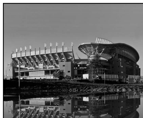
Estadio Peter Mokaba Ciudad: Polokwane Capacidad: 46 000