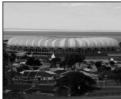
Nelson Mandela Bay Ciudad: Port Elizabeth Capacidad: 48 459