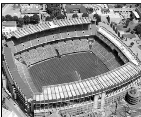
Ellis Park Ciudad: Johannesburgo Capacidad: 62 567

República de Sudáfrica Ext. (1 219 912 km 2 ) Población: 49 320 000 hab. Idioma oficial: Afrikáans