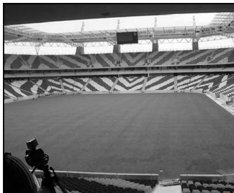
Estadio Mbombela Ciudad: Nelspruit Capacidad: 46 000