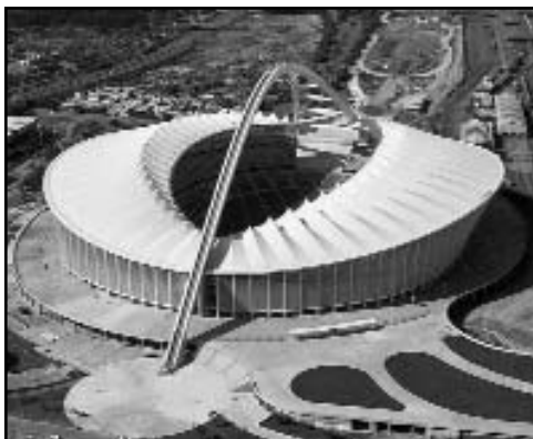
Moses Mabhida Ciudad: Durban Capacidad: 70 000