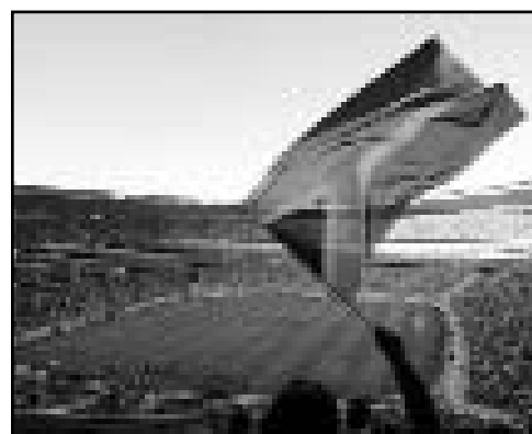
Soccer City Ciudad: Johannesburgo Capacidad: 94 700

El Soccer City, llamado por motivos publicitarios FNB Stadium (First National Bank), será sede de ocho partidos de la Copa Mundial del 2010, entre los cuales estarán el partido inaugural y la gran final.