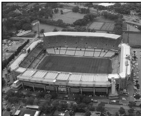
Loftus Versfeld Ciudad: Pretoria Capacidad: 50 000