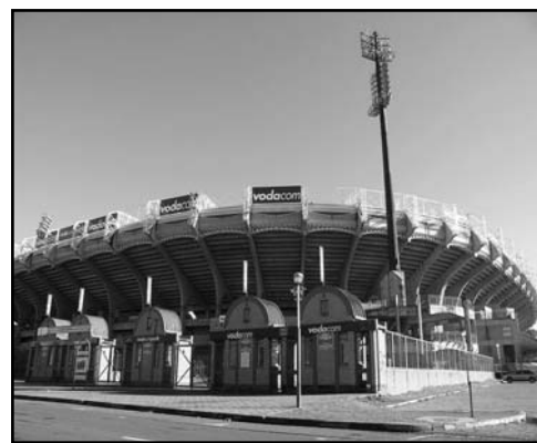
Estadio Free State Ciudad: Bloemfontein Capacidad: 48 000