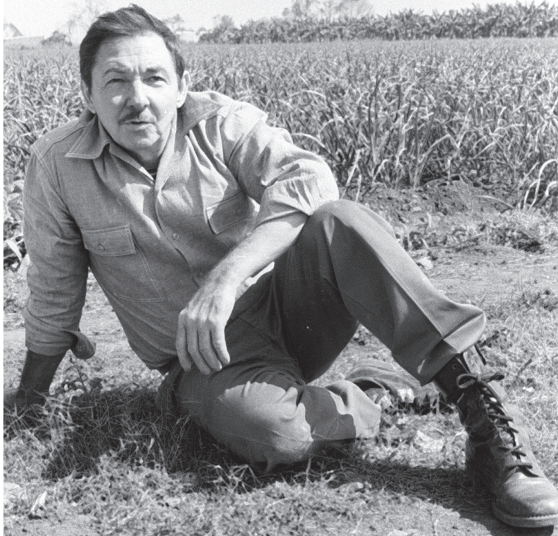
En más de 500 documentos y más de 5 000 páginas, está la historia de un hombre, joven siempre, cuyo pensamiento ha estado en línea con el de nuestro Comandante en Jefe Fidel Castro Ruz.

La colección toda es un regalo para la juventud cubana, que podrá beber de primera mano de su gesta libertadora más reciente, y conocer mejor el camino de la Revolución a partir de