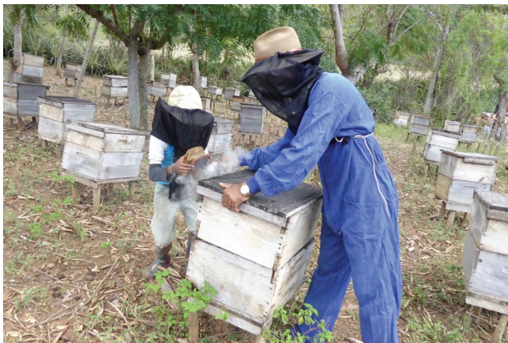
«De colmenas quiere saberlo todo este niño —comenta el padre—; en realidad conoce bastante, y se divierte cuando está en el apiario».

—Diez años —respondió el muchacho—. Y su voz de nuevo parecía familiar. «Mire, pa' cortar un árbol de por aquí, hay que pensarlo antes», dijo con severidad.