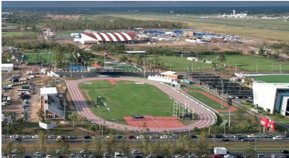
El Parque Olímpico será el epicentro del deporte juvenil continental.

Este número supera en 18 atletas a la delegación que representó a Cuba en la primera edición de los Juegos Panamericanos Junior, en Cali-Valle, en 2021, y es un resultado que evidencia el esfuerzo constante de las estructuras deportivas cubanas por mantener activa y competitiva a su reserva atlética, que se alista en este