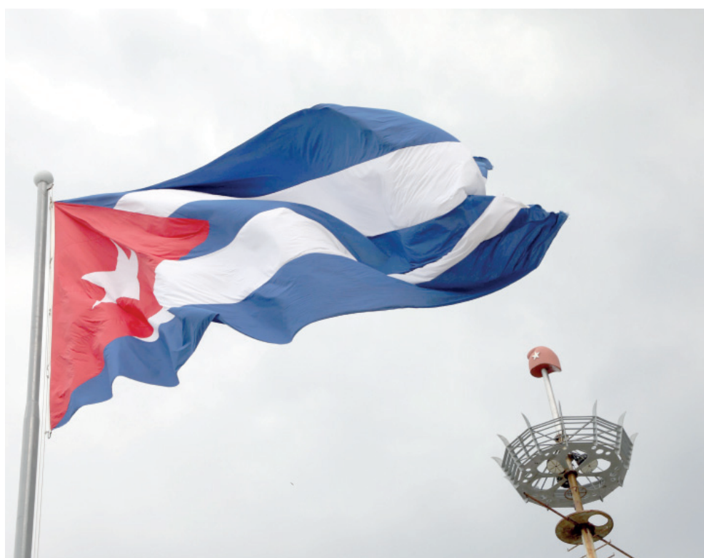
Tienen calificativo los violentos enemigos del pueblo cubano: son los verdaderos terroristas.

La nueva lista, publicada en la Resolución No. 13 (2025) y en la Gaceta Oficial de la República de Cuba, contempla 62 personas, nacidas en Cuba, pero no residentes, y 20 entidades terroristas, en virtud de la Resolución 1373 (2001) del Consejo de Seguridad de la ONU, el Derecho Internacional y el ordenamiento jurídico interno, comunicó