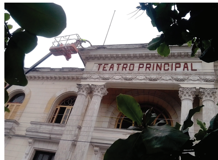
De acuerdo con la valoración de especialistas, el inmueble presenta una favorable situación en cimientos, columnas, paredes y cubierta.

La del teatro es otra obra de impacto que se suma a las más de 800 en las que se trabaja aquí, como parte del movimiento, popular y político que ocupa las jornadas previas al Día de la Rebellión Nacional.