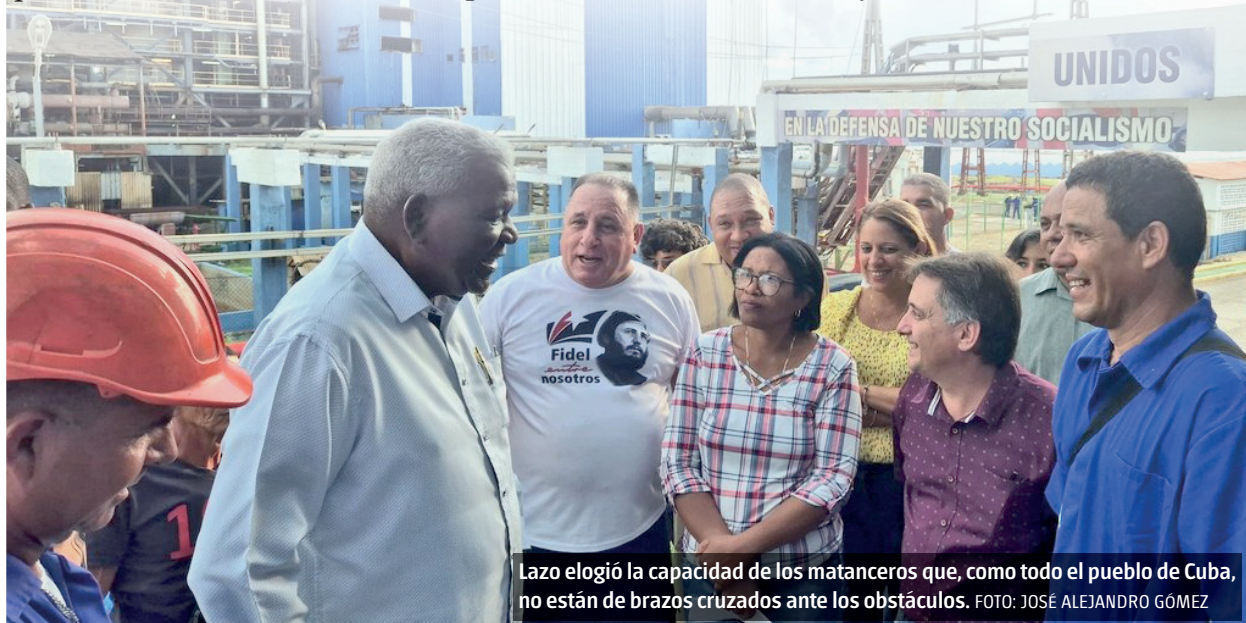
Lazo elogió la capacidad de los matanceros que, como todo el pueblo de Cuba, no están de brazos cruzados ante los obstáculos.

El recorrido incluyó otros centros que caracterizan la vida y la voluntad de los matanceros por seguir «guapeando contra viento y marea».