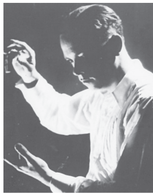
Amadeo Roldán es, sin duda alguna, uno de nuestros referentes vanguardistas de todos los tiempos.

Ahora bien, hay varias aproximaciones que definen a Roldán como el pionero del arte sinfónico moderno en Cuba, así como el primer músico de la Isla que incorporó instrumentos afrocubanos a sus obras. Sin embargo, más allá de esas definiciones —que musical e históricamente son válidas— considero que deben tomarse otros conceptos para definir su grandeza musical, pues existen líneas muy similares entre el papel innovador que tuvieron