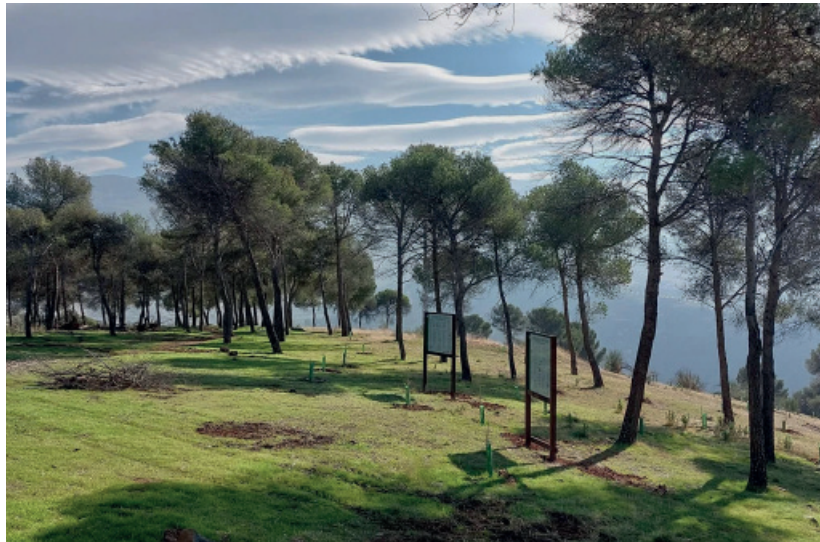
Bosque de la Poesía y la Biodiversidad de Granada.

—La propuesta de los bosques de la poesía nació en Villa Carlos Paz, en la árida provincia argentina de Córdoba, en noviembre de 2020, como un acto de resistencia y esperanza frente a una gran crisis ambiental que afectaba directamente a la ciudad. Ese año, las sierras cordobesas sufrieron incendios devastadores,