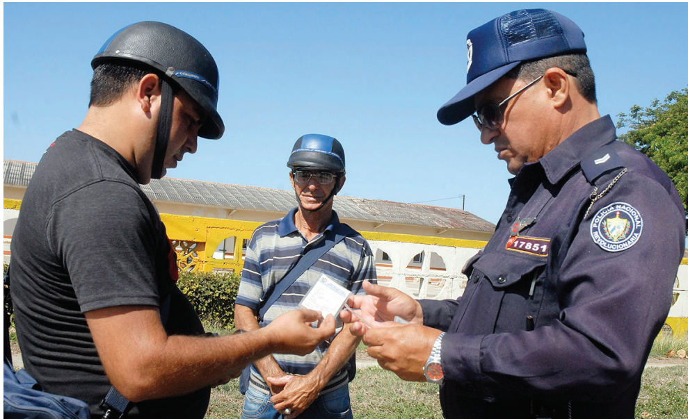
Pueden ser sujetos de contravenciones tanto las personas naturales como jurídicas.

Asimismo, manifestó que el proceso de consulta especializada contribuyó