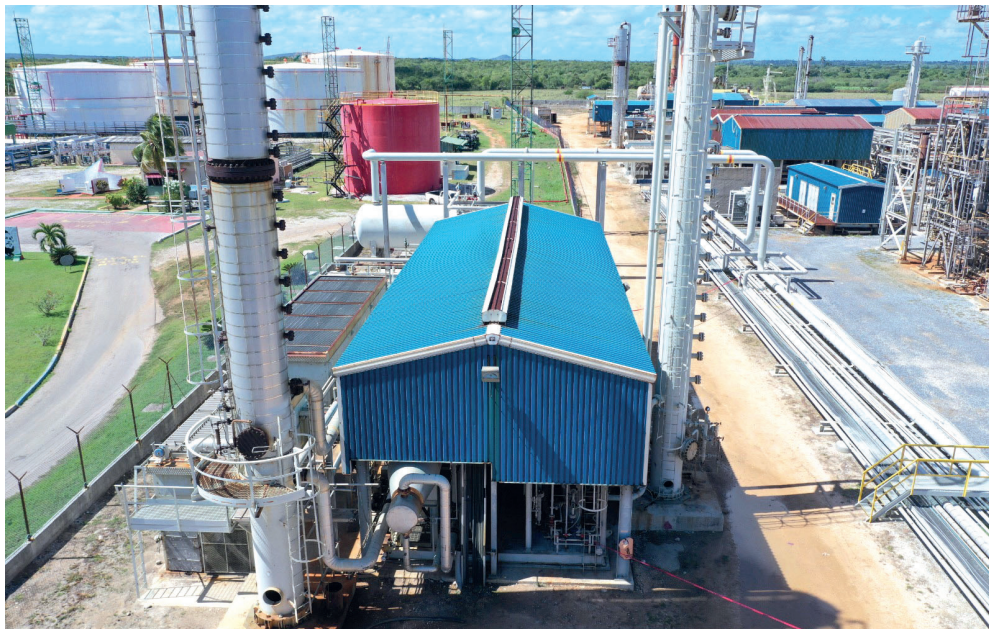
En la delicada situación actual del Sistema Eléctrico Nacional, el aporte de Energas Varadero es una garantía valiosa.

La cualidad más apreciable es la limpieza y el orden. En cada espacio se advierte el respeto ambiental. El esfuerzo porque todo esté limpio, pintado y con