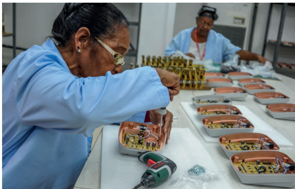
La introducción de esta tecnología comprende tres etapas, en las que ampliará paulatinamente su alcance.