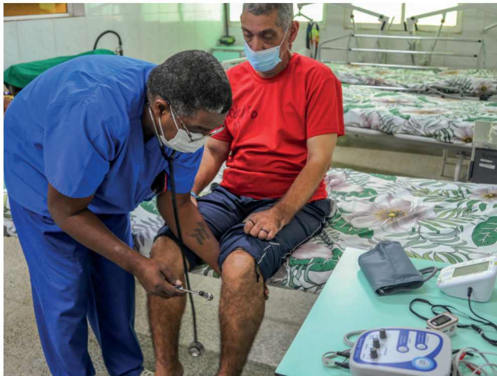
El kit permite a los médicos ofrecer un diagnóstico más preciso y un mejor seguimiento de las condiciones de salud en los pacientes.