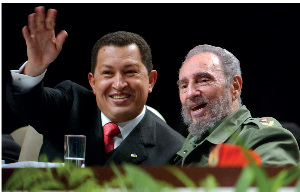
Entre la Revolución Cubana y la Bolivariana, y sus principales líderes, Fidel y Chávez, existen legados emancipadores con validez total para el presente y el futuro.

La pertinencia del tema guarda relación, entre otras razones, con los abundantes «análisis» de la derecha, que