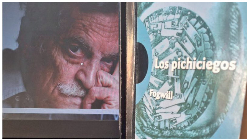
Los pichiciegos es una novela corta, intensa y devastadora, como lo fue el conflicto al que alude.

De forma incisiva, mediante una prosa ríspida y veloz, Fogwill —uno de los grandes autores contemporáneos de su país— explora sin clemencia en lo que la guerra hace con los hombres, por intermedio de esa indiferencia que se entroniza después de haber visto