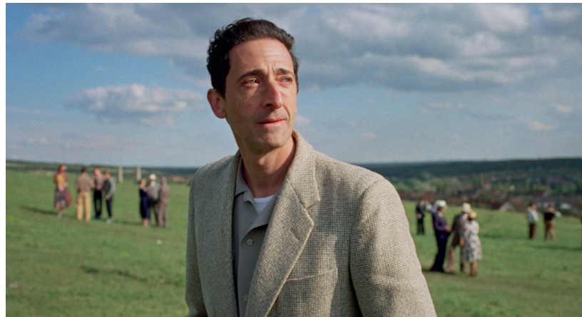
Adrien Brody, justo Mejor Actor Protagonista, por El brutalista .

A fuer de sincero, el Oscar 2025, entregado el domingo, ha sido uno de los de mayor equilibrio del decenio en curso. Eso tampoco