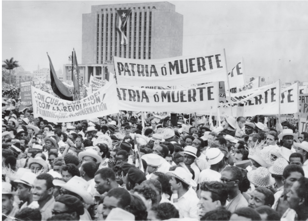
¡Patria o Muerte! ha sido, desde aquel día inolvidable, nuestra más intransigente consigna.