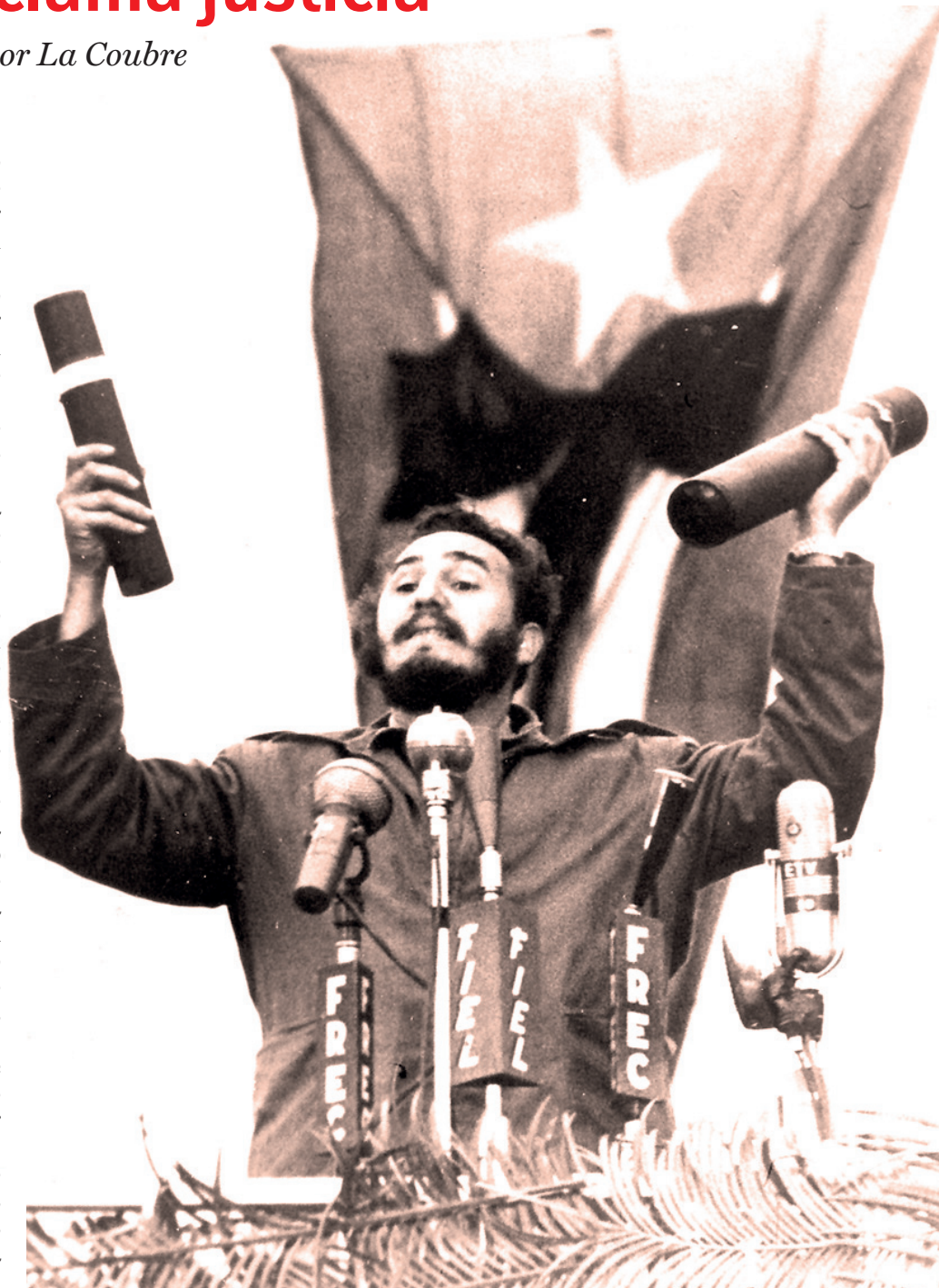
Fidel denunció el crimen como un acto de terror de los enemigos de la Revolución.

Asistieron al simbólico acto de justicia, los miembros del Buró Político Manuel Marrero Cruz, primer ministro, y Roberto Morales Ojeda, secretario de Organización del Comité Central; así como dirigentes del Partido, de la Unión de Jóvenes Comunistas, de organismos de la Administración Central del Estado, y otras autoridades.