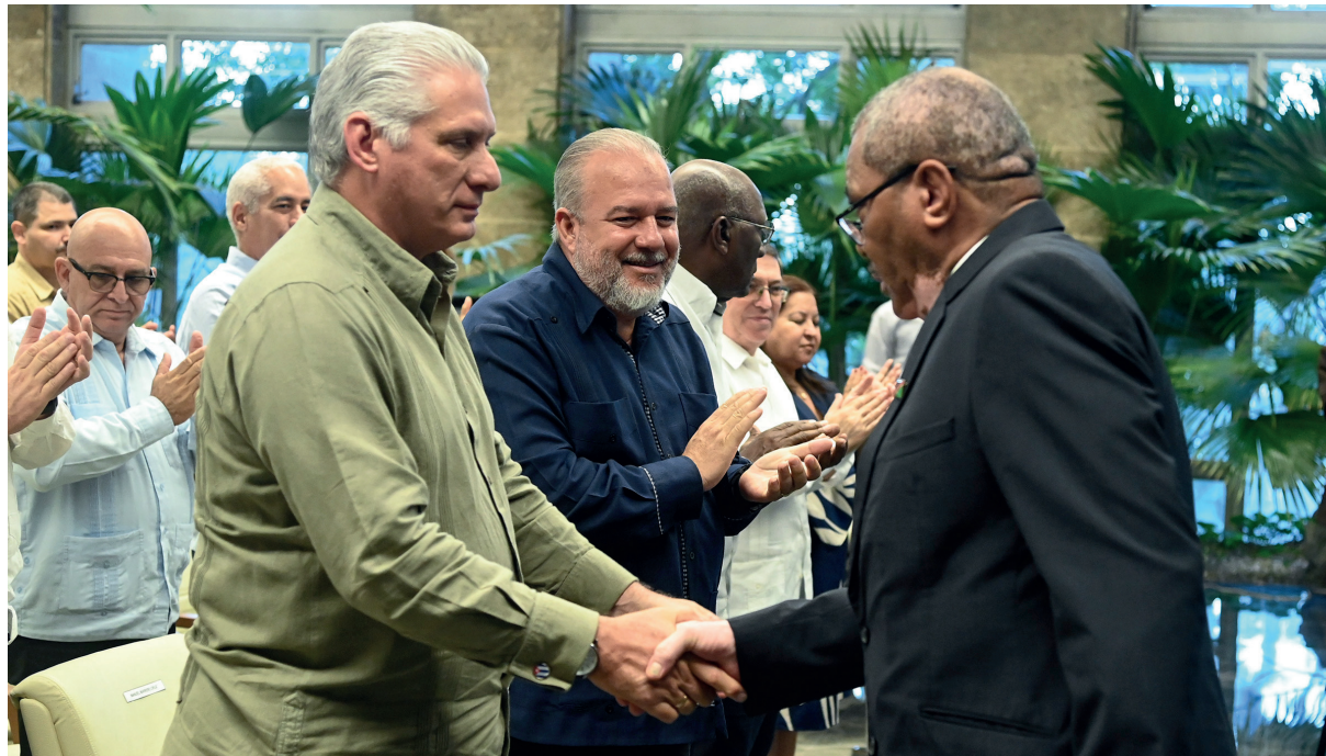
El merecido homenaje «a este gigante de la historia universal» fue guiado por su amistad con el Comandante en Jefe Fidel Castro Ruz.

dijo, «no se trata solo de la pérdida de un individuo, sino del cierre de un capítulo de la historia. Sin embargo, también es un recordatorio del poder perdurable de su visión y de la responsabilidad que tenemos de defender su legado. Un pionero planta las semillas de un futuro mejor y, aunque ya no camine entre nosotros en la tierra, sus sueños siguen creciendo en los corazones de aquellos a quienes inspiró».