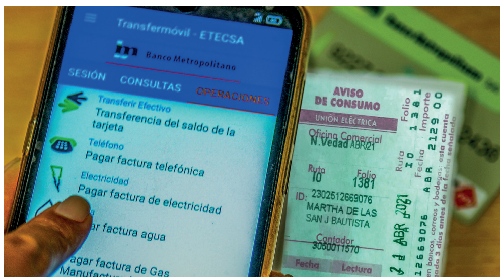
Se prevé crecer en el servicio de Transfermóvil y aumentar las ventas por concepto de exportación.

Asimismo, contemplan que la Unión de Informáticos de Cuba y los Joven Club de Computación y Electrónica continúen con sus programas educativos, implementar por el sector proyectos de I+D+i, desplegar el proyecto piloto de telemedicina en el municipio de Plaza de la Revolución, incrementar el número de empresas incubadas en los Parques Científicos Tecnológicos, e incluir la Transformación Digital en los proyectos