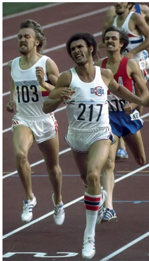
Alberto Juantorena también acabó con los favoritos de los 800 metros, en Montreal-1976.

Si bien son dos organizaciones de prestigio y avalados resultados, pues,