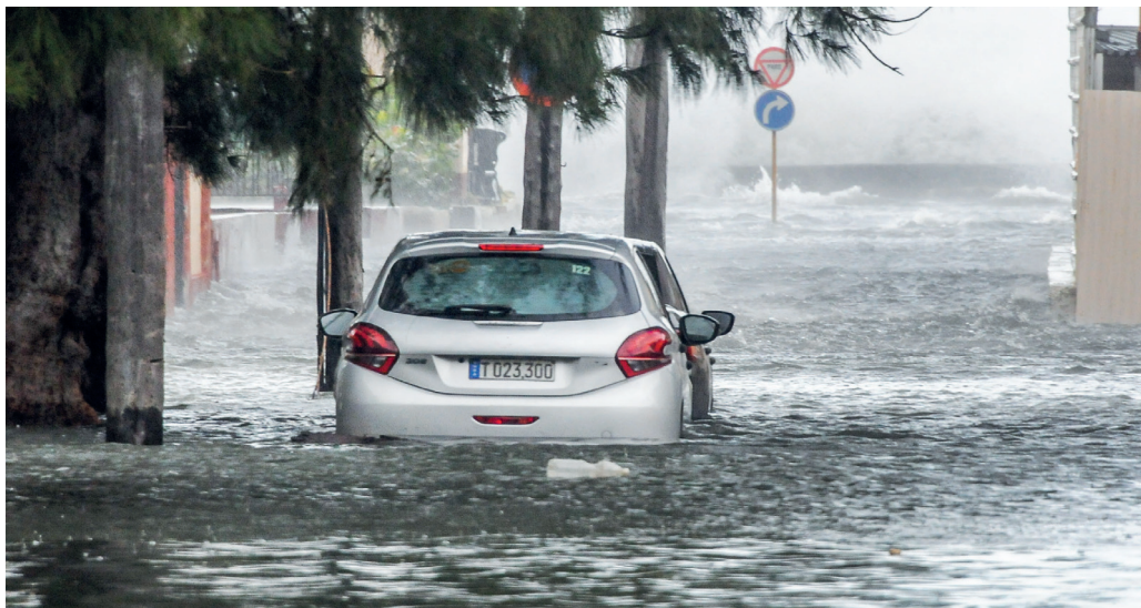
Las fuertes marejadas provocaron inundaciones en las zonas cercanas al malecón habanero.