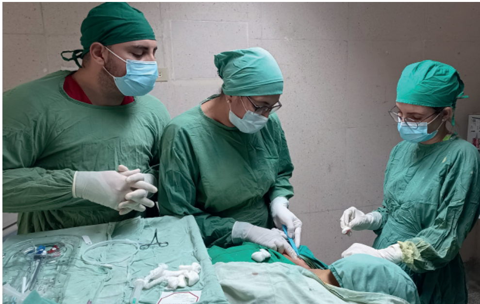
El pequeño salón creado para realizar los procedimientos de la nefrología intervencionista da respuesta inmediata a la colocación de catéteres.

De la validez del curso habla la decisión de la Sociedad Internacional de Nefrología de inscribirlo como uno de sus programas de embajadores educacionales.