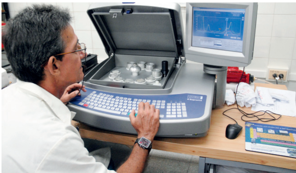
De los 17 programas nacionales de Ciencia, Tecnología e Innovación, ocho son gestionados por instituciones de Educación Superior.

Agregó que, de los 17 programas nacionales de Ciencia, Tecnología e Innovación, ocho son gestionados por instituciones de Educación Superior, actividad que se respalda con un claustro, en el cual el 90 % de los profesores e investigadores ostenta los grados de