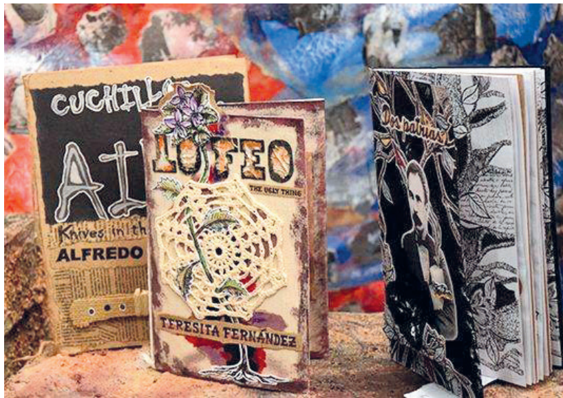
Los libros de Vigía resultan siempre impactantes y novedosos, sin dejar de responder a su muy particular sello.

Las palabras del Apóstol: «de luz se han de hacer los hombres y deben dar luz», integrarán el