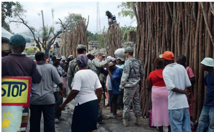
Soldados norteamericanos abusan y golpean a un haitiano en Puerto Príncipe, cuando este país sufría las secuelas del fuerte terremoto.

Parece sacado del guion de un filme barato de Hollywood, de una historieta de héroes y villanos.