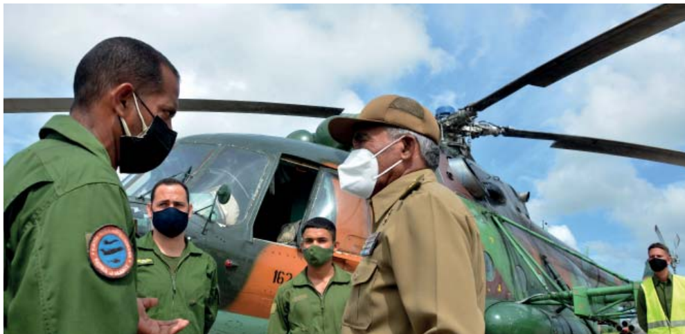
Para el general de Brigada de la reserva, Arnaldo Tamayo Méndez, la preparación técnico-profesional, física y político-ideológica es fundamental para los pilotos de estos tiempos.

Sobre su hazaña en el espacio, una de las más grandes para su época, comentó que el vuelo fue un acontecimiento de elevado contenido político, pues un país bloqueado económica, comercial y financieramente por EE. UU., subdesarrollado, sin tecnología aeroespacial, se convirtió en el primero del llamado Tercer Mundo en alcanzar el cosmos.