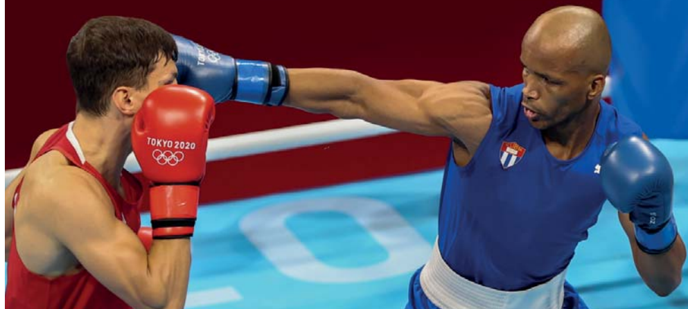
Roniel Iglesias, púgil cubano con tres medallas olímpicas.