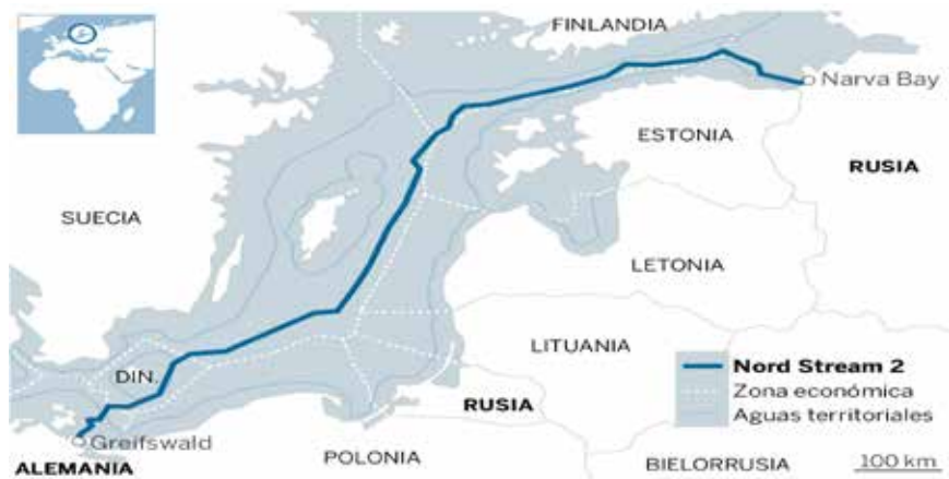
El gasoducto Torrente Norte 2, conocido también por Nord Stream 2, en fase de construcción por varios países. ILUSTRACIÓN DE EL PAÍS