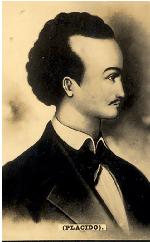
El 18 de marzo de 2019 se cumplieron 210 años de la llegada al mundo, en la ciudad de La Habana, de Gabriel de la Concepción Valdés (Plácido).

(Trato de reconstruir uno de esos episodios de la vida que no se registran en las cronologías). Gabriel se puso de punta en blanco. Encima de una mesa, a salvo de los azares del camino recorrido desde la puerta de su morada en Matanzas, resplandecía la peineta carey con incrustaciones de plata que sus manos habían creado por encargo de una dama habanera, de cuyo amor por las artes había tenido noticia más de una vez. «Quién sabe si esta será la última peineta que salga de mis