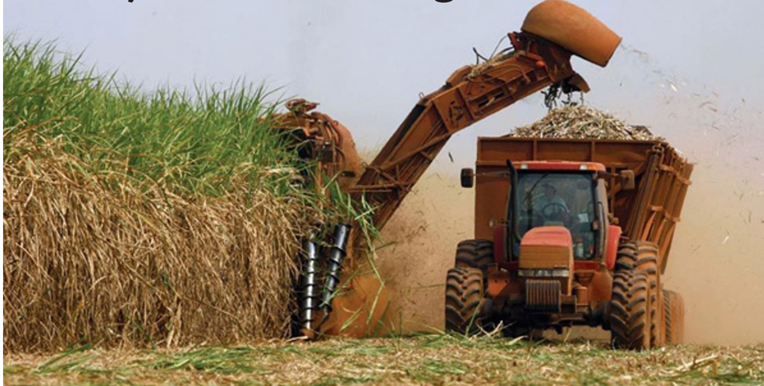
El compromiso de los villaclareños es cumplir el plan de azúcar en la presente contienda.