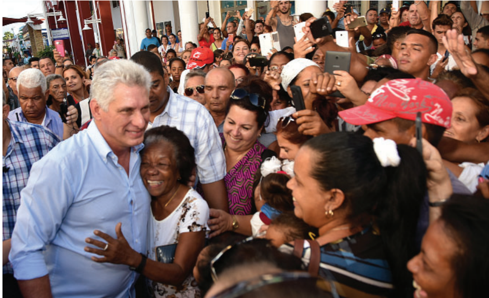
Miguel Díaz-Canel en recorrido por el pueblo de Artemisa.

La indiferencia o el «no cojas lucha» no puede ser la respuesta cuando acudimos a un centro hospitalario donde se han hecho inversiones millonarias para garantizar la más completa salud del