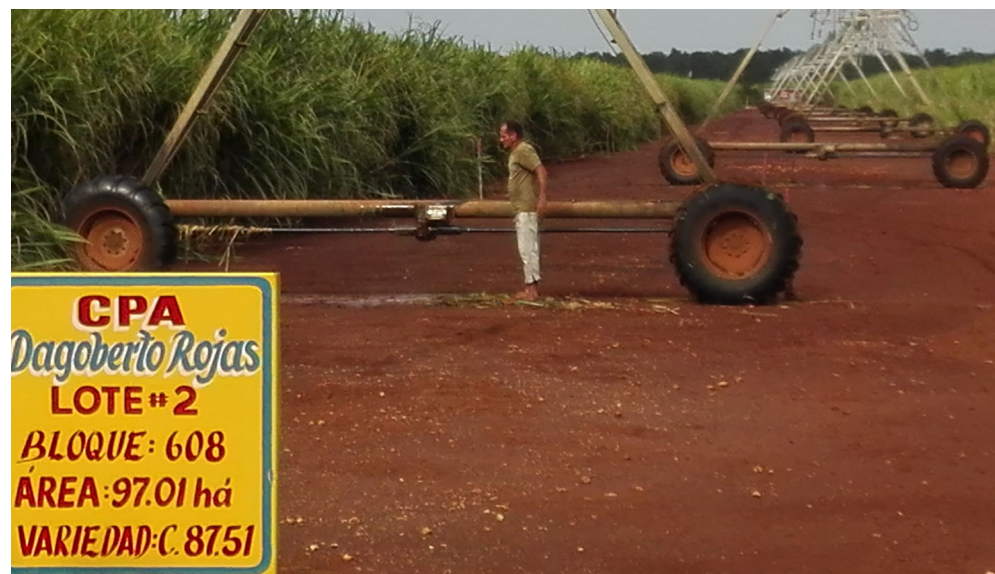
El uso correcto de las máquinas de riego es un rasgo distintivo de la CPA Dagoberto Rojas.

A veces uno no puede hacer nada por impedirlo, pero es importante estar