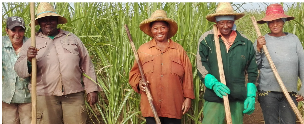
El aporte de la mujer es clave en la CPA Dagoberto Rojas.

uso de los recursos y de los sistemas de riego, así como la disciplina tecnológica.