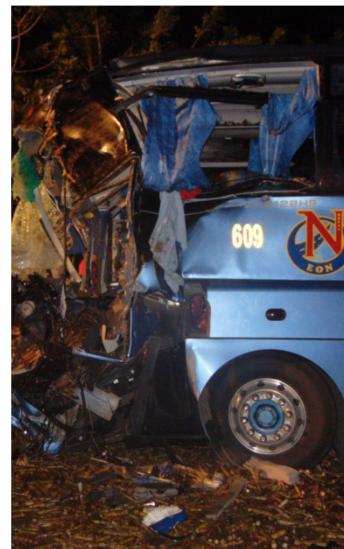
El accidente ocurrió en la zona conocida como El Chorizo, cerca de Jatibonico.

Fuentes del Ministerio del Interior que laboran en el esclarecimiento de los hechos aseguraron que antes de