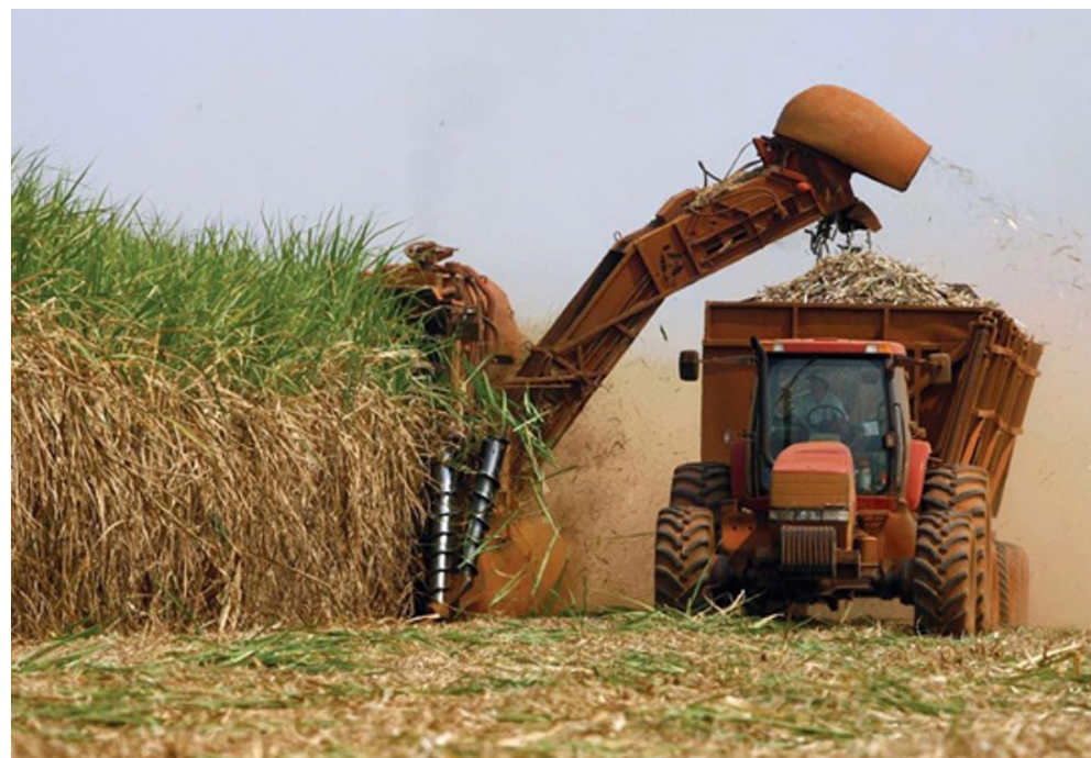
La alternativa para que los cañaverales vuelvan a convertirse en tesoro de la economía no reside tanto en el azúcar crudo, como en la producción de los llamados derivados.

Los proyectos sueñan con 25 bioeléctricas. Con una capacidad total de 4 300 gigawatts/hora (gw/h) al año, asumirán el 14 % de la matriz energética cubana y la mayor participación en el programa de fuentes renovables de energía, que