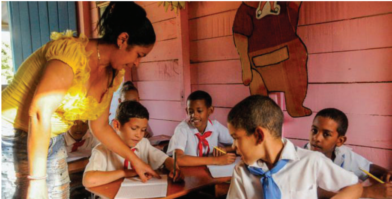
Cuba aspira a garantizar la mayor suma posible de derechos a su población desde el 1ro. de enero de 1959.