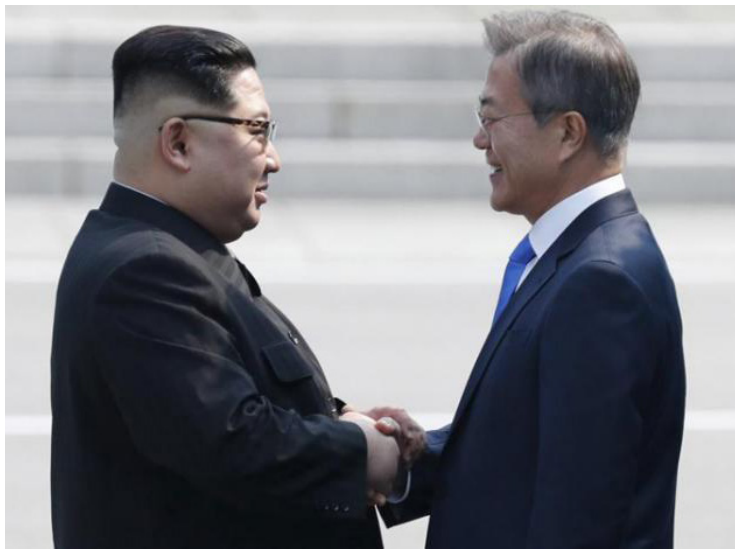
Hoy el mundo acoge con beneplácito el documento conjunto emitido al final de la tarde de este viernes por Pyongyang y Seúl.

Hoy el mundo acoge con beneplácito el documento conjunto emitido al final de la tarde de este viernes por Pyongyang y Seúl. Este precisa que tanto el Mariscal