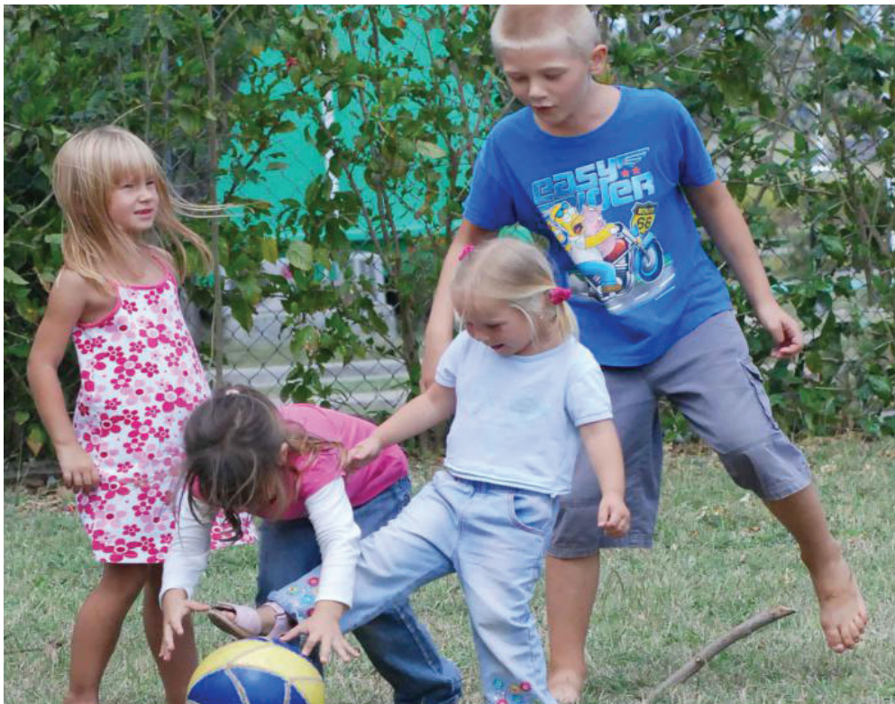
Pacientes descendientes de personas afectadas por irradiaciones de la central nuclear también han sido atendidos en Tará.

Este 26 de abril el accidente de Chernobil sopló las velitas del aniversario de lo atroz. Algunas agencias, a 32 años del desastre, no pueden obviar que entre 1990 y 2016 más de 26 000 personas afectadas, en especial niños, fueron asistidos en la Isla como parte de una voluntad política colosal, sin comparación en el mundo, porque fuimos el único país que organizó un programa integral de salud, masivo y gratuito para la atención de las herencias dolorosas de Chernobil.