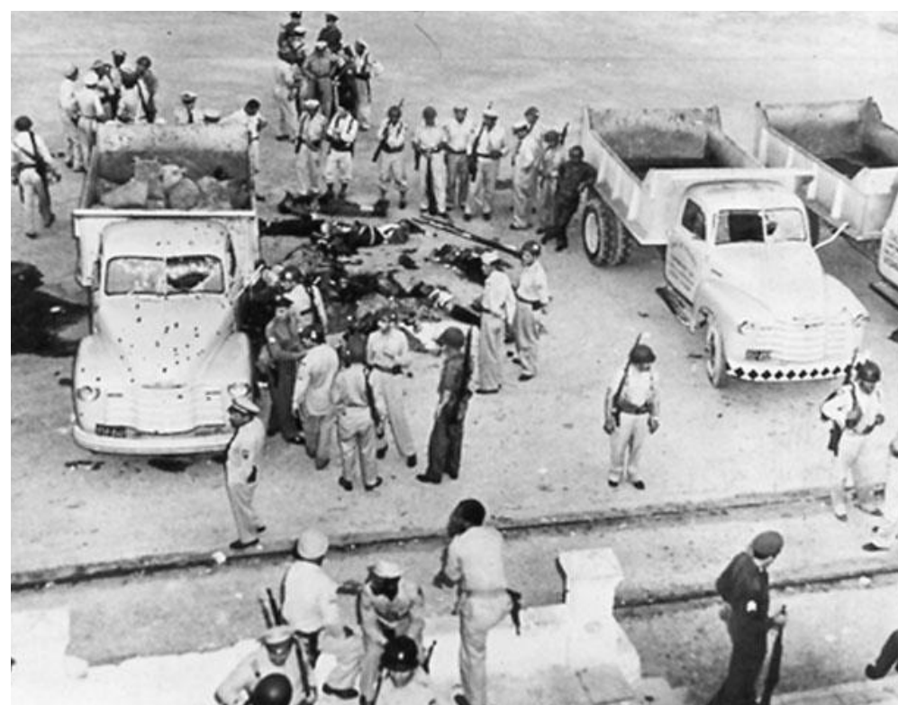
Después del asalto.