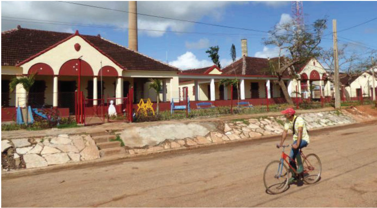
Batey Jaronú.