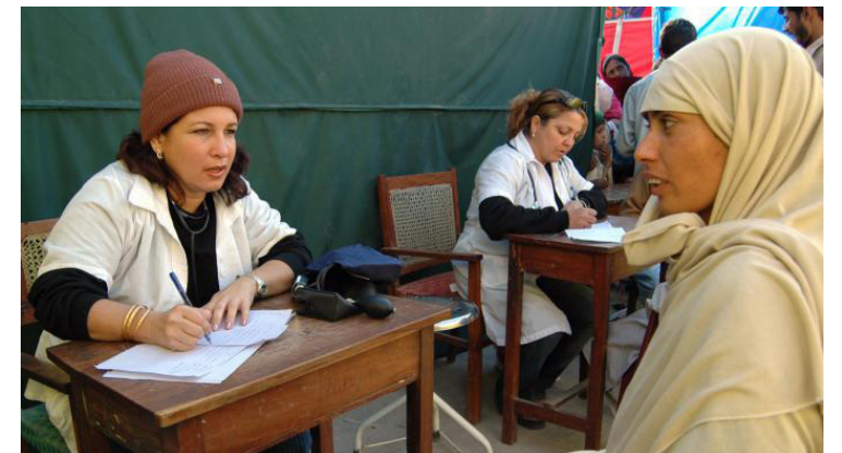
En el 2005, la brigada médica cubana en Pakistán atendió a más de 1 700 000 pacientes.

Pakistán reconoció con su máxima distinción civil al líder histórico de la Revolución Cubana