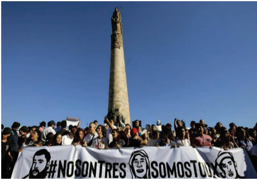
Estudiantes marchan luego del asesinato de tres estudiantes de cine a manos del narcotráfico.