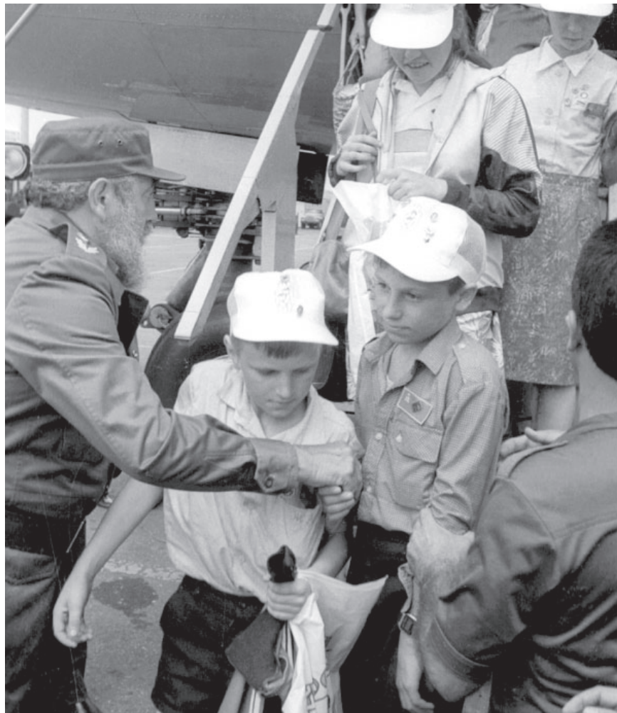
Fidel recibe a niños de Chernobil el 29 de marzo de 1990.

«Cuba sola ha atendido más niños de Chernobil que todo el resto de los