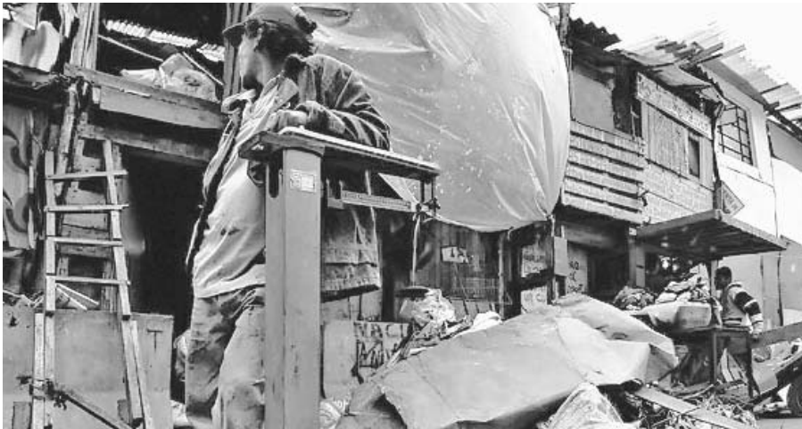
Las diferencias entre ricos y pobres en las principales ciudades colombianas ha aumentado en las últimas dos décadas.

BOGOTÁ.—Colombia encabeza los índices de inequidad urbana en América Latina con cuatro ciudades incluidas en esa clasificación, Medellín, Cali, Montería y Bogotá, según un estudio de la Oficina Global de la ONU-Hábitat.