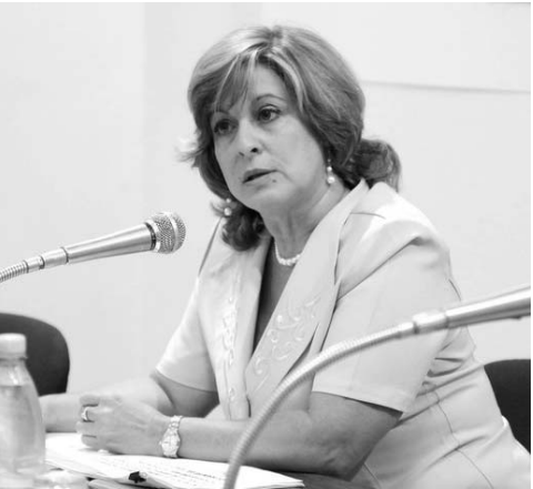
La ministra de Justicia, María Esther Reus.

Según la Titular cubana, en la nación caribeña existen todas las condiciones para asegurar la cooperación y la asistencia judicial en la materia, sustentadas en la legislación vigente, los acuerdos bilaterales y multilaterales de los que el país es signatario.