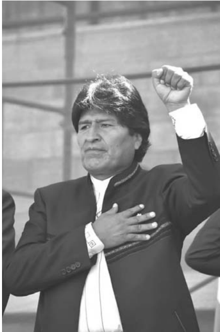
Evo Morales en la Universidad de La Plata, Argentina.

Doctor Honoris Causa en las universidades de Lanús y San Martín.