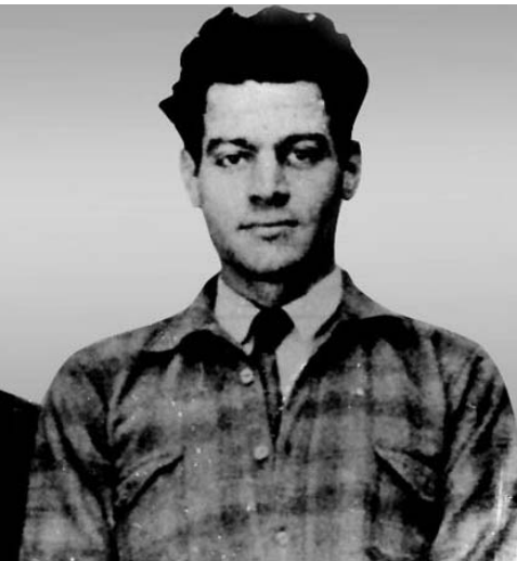
Julio Antonio Mella.

Su líder tuvo que salir de Cuba en enero de 1926 hacia México; y allí fue asesinado en manos de los sicarios de