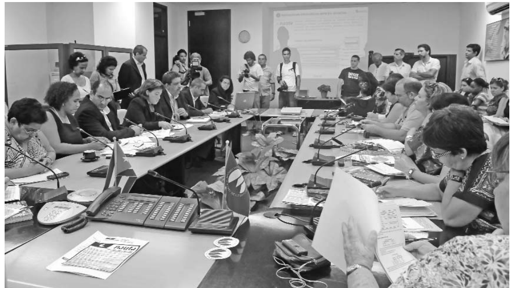
Funcionarios de ETECSA ofrecieron una rueda de prensa sobre la ampliación del servicio de Internet.

Se continuarán dando pasos para avanzar en el acceso social y se ratifica la voluntad del Gobierno y el Estado cubanos de ampliar los servicios de Internet, en la misma medida que los recursos económicos lo permitan. No será el mercado el que regule el acceso al conocimiento en nuestro país.