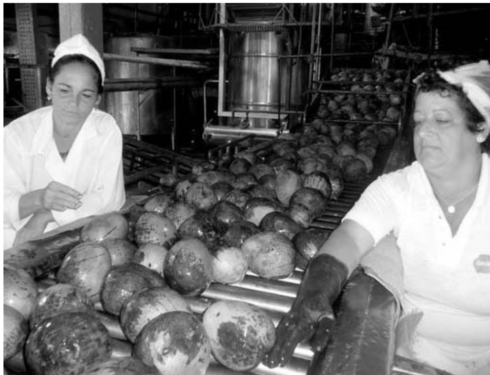
Durante años, La Conchita se vio obligada a traer tomate de China, mango y guayaba de Brasil y coco de Sri Lanka, para poder trabajar.