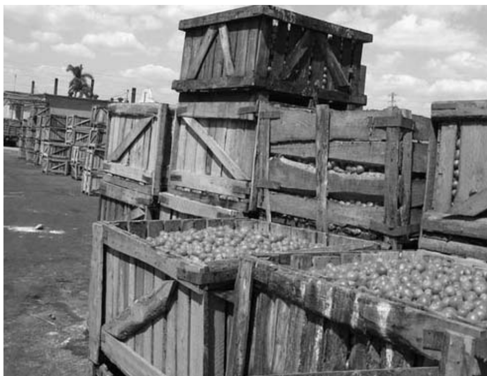
Las montañas de cajas llenas de frutas u hortalizas frescas que se acumulan en la industria la mayor parte del año, confirman que ya no es preciso importar materias primas.