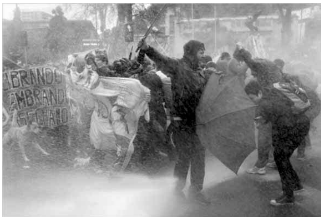
La policía chilena dispersó a los manifestantes con chorros de agua.

Según EFE, la movilización fue convocada por las principales organizaciones de estudiantes universitarios y secundarios, que exigen al Gobierno una reforma pro-