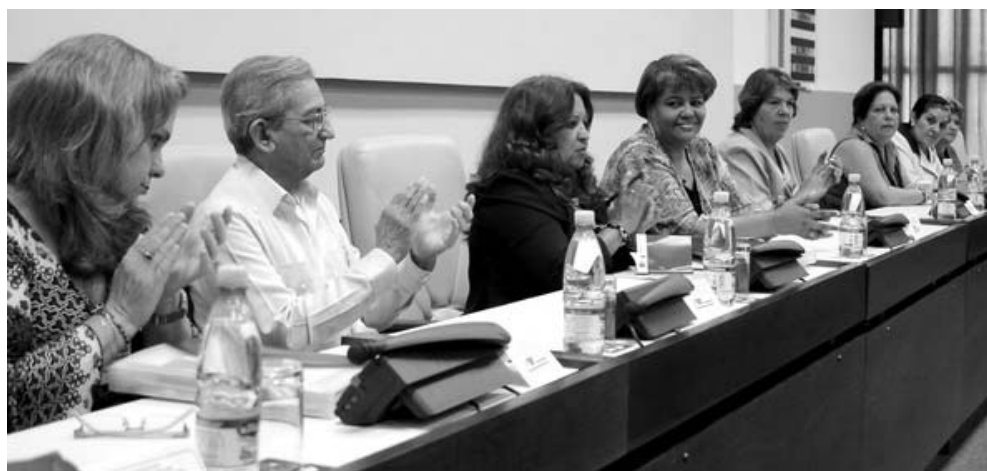
Participaron en el encuentro, de izquierda a derecha, José Ramón Balaguer, Olga Lidia Tapia Iglesias, miembros del Secretariado del Comité Central del Partido, y Teresa Amarelle Boué, secretaria general de la FMC.