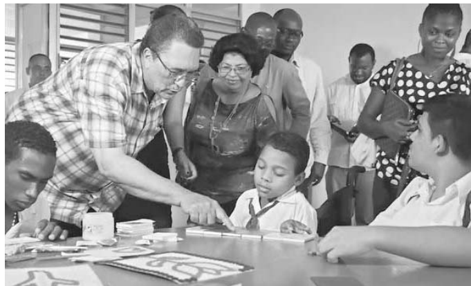
El Primer Ministro de Santa Lucía, Kenny Davis Anthony, aseguró que recordará a cada uno de los niños que conoció en la Escuela Especial Solidaridad con Panamá.