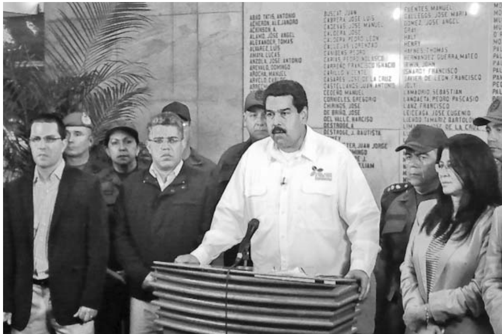
El vicepresidente Ejecutivo, Nicolás Maduro, le habló en cadena nacional al pueblo venezolano.

A nuestro pueblo le pedimos canalizar nuestro dolor