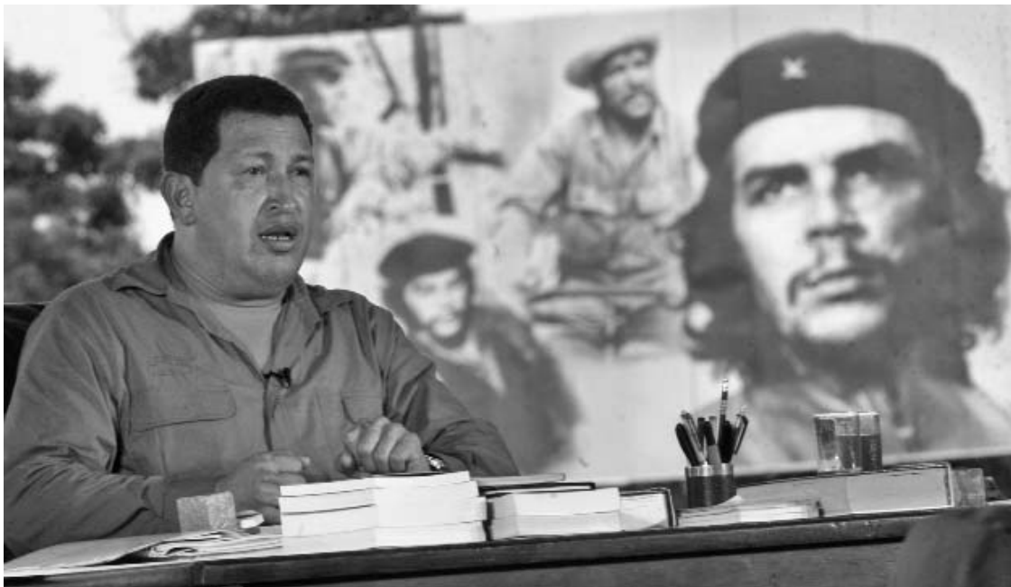
Chávez se dirige al pueblo durante una visita a Villa Clara.