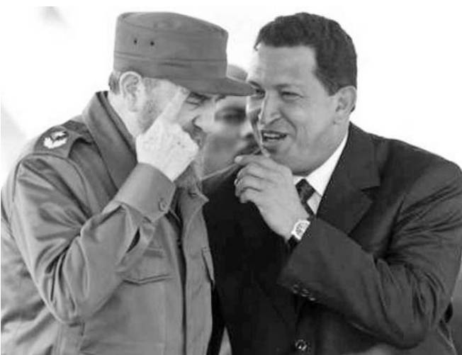
Chávez y Fidel en uno de sus tantos encuentros.