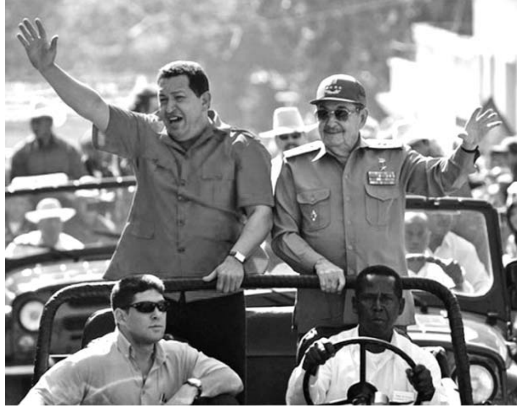
El líder bolivariano, Hugo Chávez, y Raúl Castro, en Santiago de Cuba en diciembre del 2007.