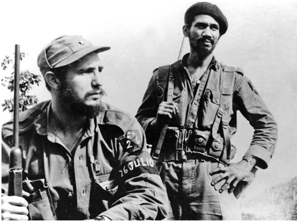
Almeida junto a Fidel en la Sierra Maestra.