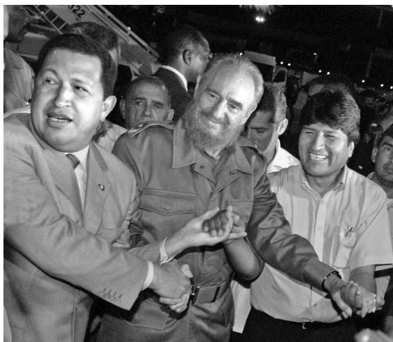
Grandes líderes latinoamericanos: Chávez, Fidel y el presidente de Bolivia, Evo Morales.