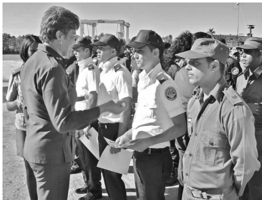
A una selección de jóvenes le fue conferida la distinción "Joven 50 aniversario".

Durante la conmemoración, combatientes destacados recibieron el ascenso en grados, se otorgó la Distinción por el Servicio Distinguido en el MININT, se entregaron carnés de la Unión de Jóvenes Comunistas (UJC), así como diplomas con la Condición