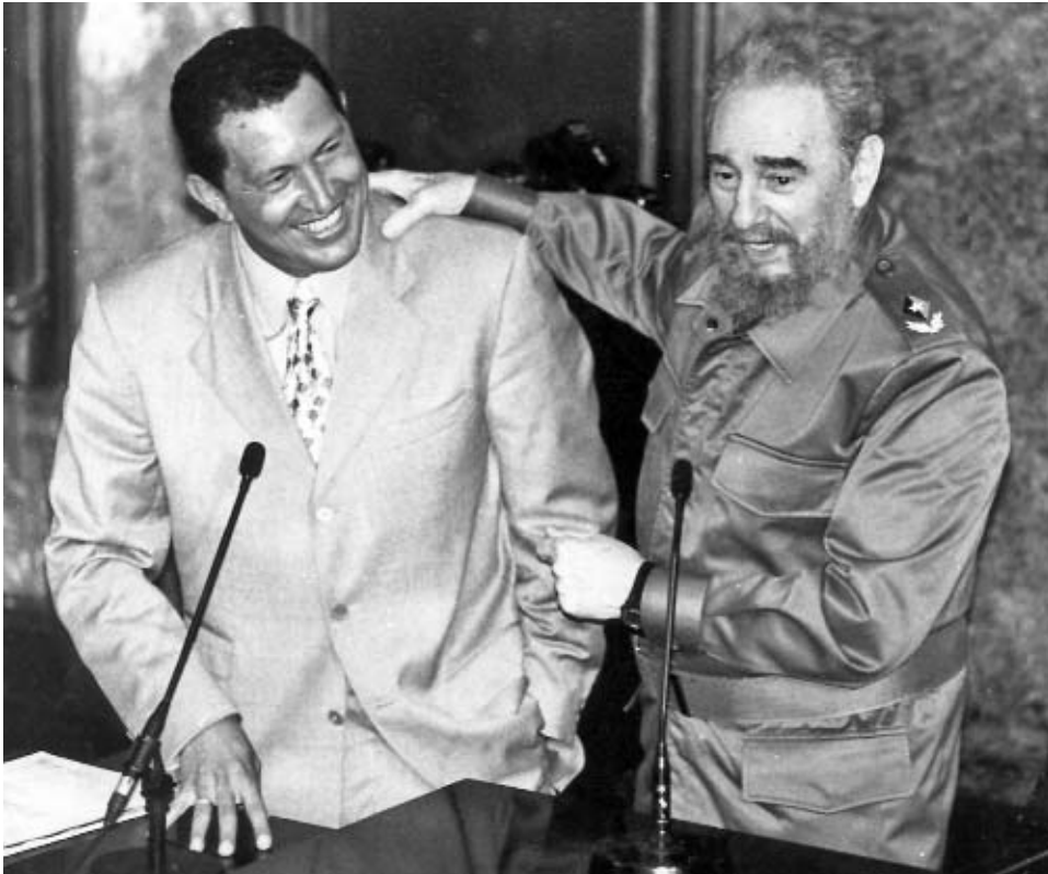
Hugo Chávez y el líder de la Revolución Cubana, Fidel Castro, en el Aula Magna de la Universidad de La Habana en 1994.