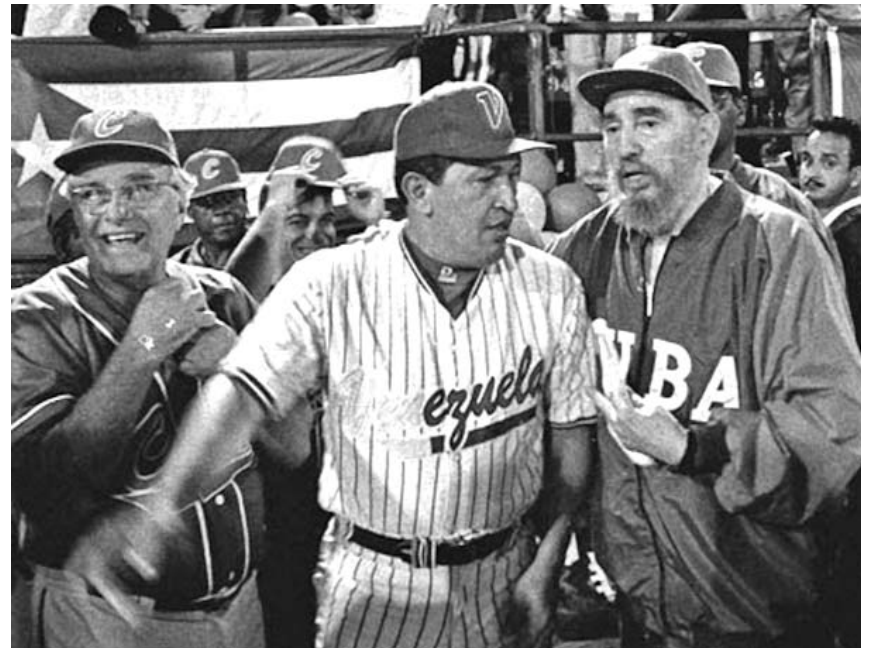
Chávez y Fidel durante uno de los legendarios juegos de pelota.