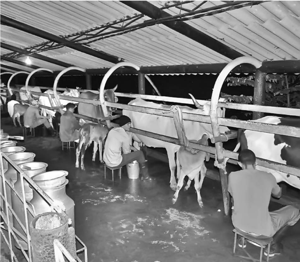
El traslado de ganado de la UBPC permitió hacer un mejor uso de la tierra.

abandonamos la idea de cosechar arroz que fue lo que nos trajo aquí”. Por tal razón en la presente etapa sembrarán unas 130 hectáreas de arroz semilla, lo que garantizará las producciones del cultivo, de quienes se acojan al Decreto Ley No. 300.