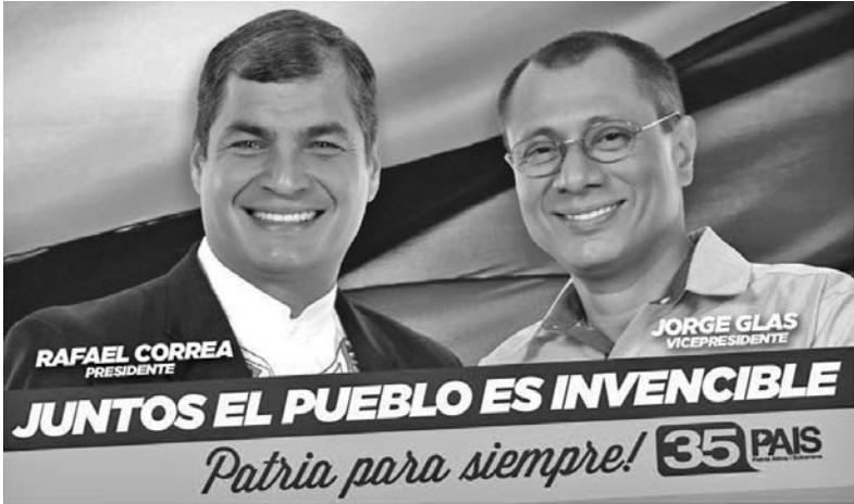
Fórmula presidencial por el Movimiento Alianza PAÍS.

Con ese fin delineó el proyecto gubernamental para un nue-