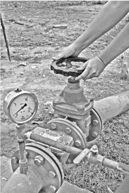
La nueva conductora, totalmente soterrada, permite la entrada de 175 litros por segundo a los depósitos de La Chanzoneta.

El proyecto de rehabilitación hidráulica en el sureño municipio espiritano —asciende a más de 50 millones de pesos en total y está concebido hasta el 2016— no solo beneficiará a la vieja ciudad, Patrimonio Cultural de la Humanidad, sino también a los asentamientos de Casilda, La Boca, La Pastora, Sanguily, Media Legua y a las instalaciones hoteleras ubicadas en la península de Ancón.