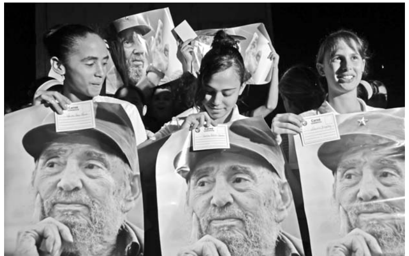
Los nuevos arribantes manifestaron su compromiso con el proceso revolucionario cubano.

“Si no fuese optimista no estaría luchando. Me gusta mucho una frase del presidente boliviano, Evo Morales: “Dejemos el pesimismo para días mejores”. Mientras haya una sonrisa hay esperanza, capacidad de resistencia, y ustedes los cubanos saben mucho de eso. Por eso los llamo la Isla de la rebeldía y de la esperanza, de la dignidad”.