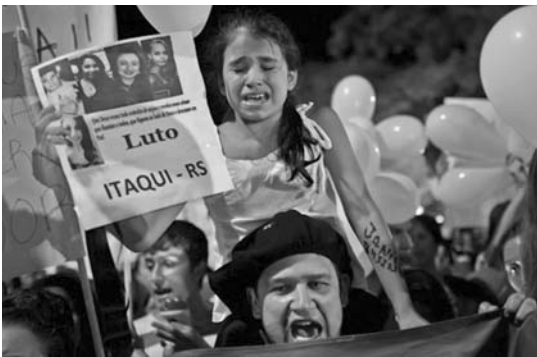
Una niña sostiene un cartel sobre una de las víctimas del incendio durante una concentración en recordatorio de la tragedia.

“Ha sido una tragedia, porque eran jóvenes, tenían sueños, podrían ser nuestros futuros políticos o lo que quisieran”, señaló, según declaraciones recogidas por el diario O Globo.