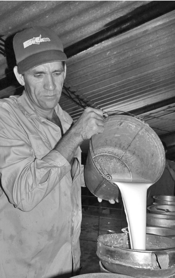
En el 2012 superaron sus compromisos, con una producción de 132 mil 546 litros de leche, más de 30 mil por encima de lo planificado.

Desde el 2006 conformaron una brigada de construcción con el fin de reparar