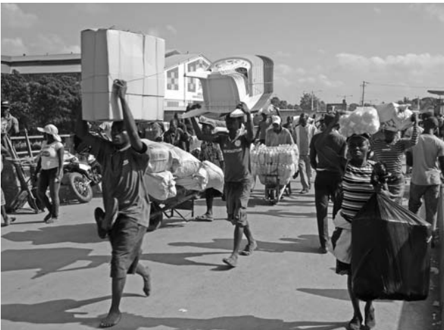
En Ouanaminthe, Martí fue testigo del trasiego fronterizo que se extiende hasta nuestros días.

El Gonaïves visto por Martí ha cambiado su rostro. La mayoría de sus calles ya no están llenas de lodo, pero en