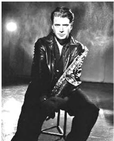
El saxofonista norteamericano Jimmy Sommers intervendrá en Jazz Plaza 2012.

El sábado la contribución foránea correrá a cargo del