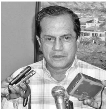
América Latina necesita la recuperación del Comandante Hugo Chávez, afirmó el canciller de Ecuador, Ricardo Patiño.

“Como una muestra más de la integración estamos aquí los países del ALBA, y estamos rápido, dijo el canciller Patiño durante el recorrido. Esperamos que los estudios concluyan rápido en cada lugar seleccionado, para iniciar la ejecución de las casas de