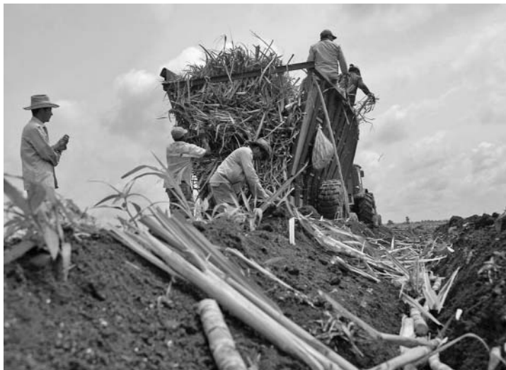
El Cristino Naranjo, en paralelo a la zafra, continuará la siembra de caña.

Así, dijo, se han creado condiciones para disminuir el índice de roturas de equipos en todos los frentes y reducir las paradas que influyen en el tiempo perdido durante las moliendas.