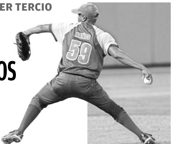
Baños ayudó a completar la barrida vueltabajera.

El equipo más oriental, Guan-tánamo, y uno de los más al oeste, Isla de la Juventud, terminaron arriba en la tabla de posiciones al término del primer tercio de la 52 Serie Nacional de Béisbol, ambos únicos con 10 victorias, en una jornada donde Pinar del Río completó una importante barrida y el cuarteto Mayabeque-Sancti Spíritus-Matanzas-Cienfuegos se mantuvo un juego detrás de los punteros.