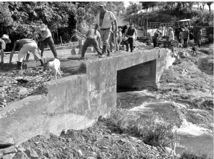
La reparación de la alcantarilla de Yeyo se convirtió en un verdadero suceso para la comunidad de Tres Guanos.

Para ser otra vez la más productora, Mayabeque pone especial énfasis en Batabanó, guía de la provincia, con casi 400 hectáreas.