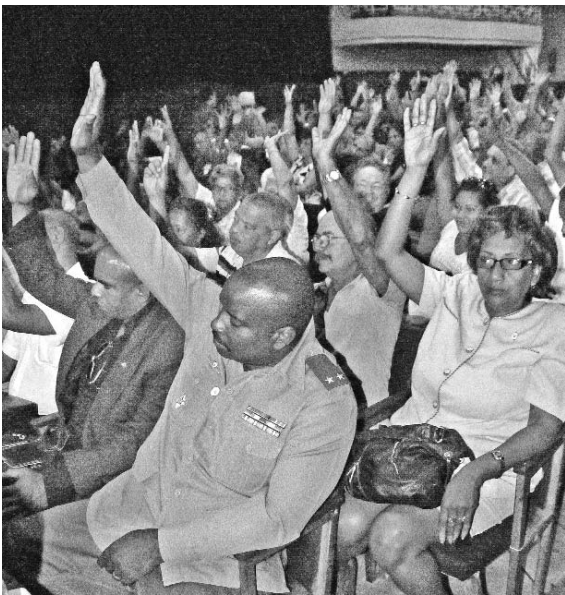
Los delegados en las 168 asambleas municipales aprobaron ayer las candidaturas para postularlas ante el pueblo.

Presentadas a los miembros de esos órganos del poder estatal por los presidentes de las comisiones de candidaturas municipales correspondientes, conforme a lo legislado, los proyectos se informaron por separado, primero la de los delegados provinciales y después la de los diputados, en número determinado proporcionalmente a los habitantes de cada demarcación y de acuerdo con el municipio que representarán en las venideras elecciones, o al distrito electoral (en esta ocasión se han creado 89), en aquellos municipios cuya población excede de 100 mil habitantes.