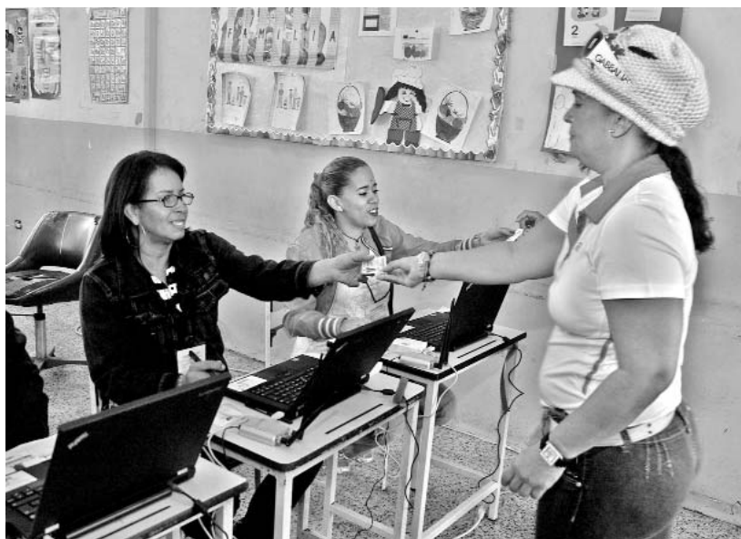
Más del 50 % de los venezolanos ejercieron su derecho al voto.

Tras conocerse los resultados, miles de venezolanos salieron a las calles y plazas de las principales ciudades del país para celebrar la victoria socialista. (SE)