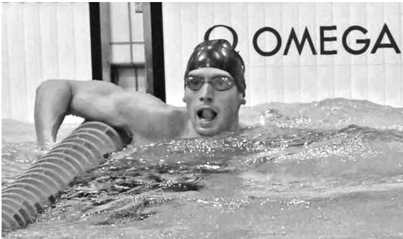
Al igual que en los Juegos Olímpicos de Londres, ahora Hanser también se incluyó entre los finalistas.

Lochte concluyó su labor en este Mundial con seis oros: en 200 libre, 100 y 200 combina-dos, 4x100 libre, 4x200 libre y el relevo combinado; una plata en los 200 espalda y un bronce en los 100 mariposa. (SE)