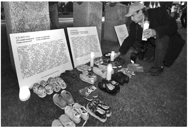
La masacre conmocionó a la localidad de Newtown, Connecticut.

Producto de esa presión, recientemente las autoridades madrileñas, por primera ocasión, abrieron la posibilidad de echar atrás el proyecto de privatización de seis hospitales y 27 centros de salud, como parte de un paquete de recortes por 500 millones de euros en el sector.