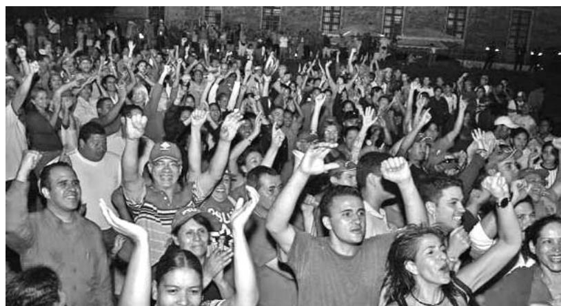
Los venezolanos celebraron en las calles la victoria.