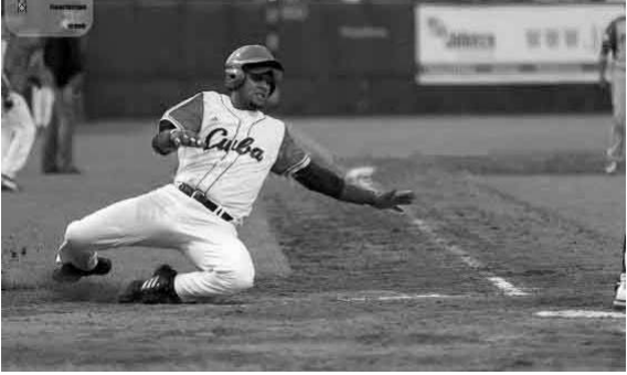
En Haarlem Yulieski Gourriel mostró una mezcla de poder, contacto, velocidad y mucha garra.