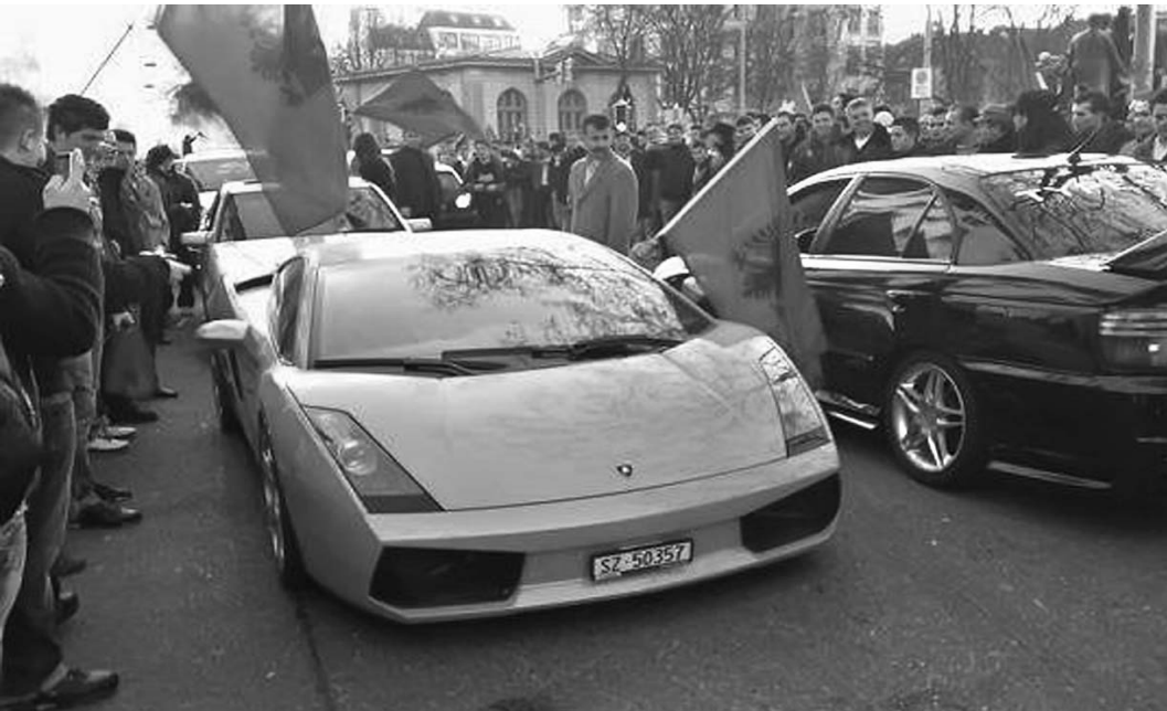
Banderas albanesas ondean en una muestra de automóviles de lujo.