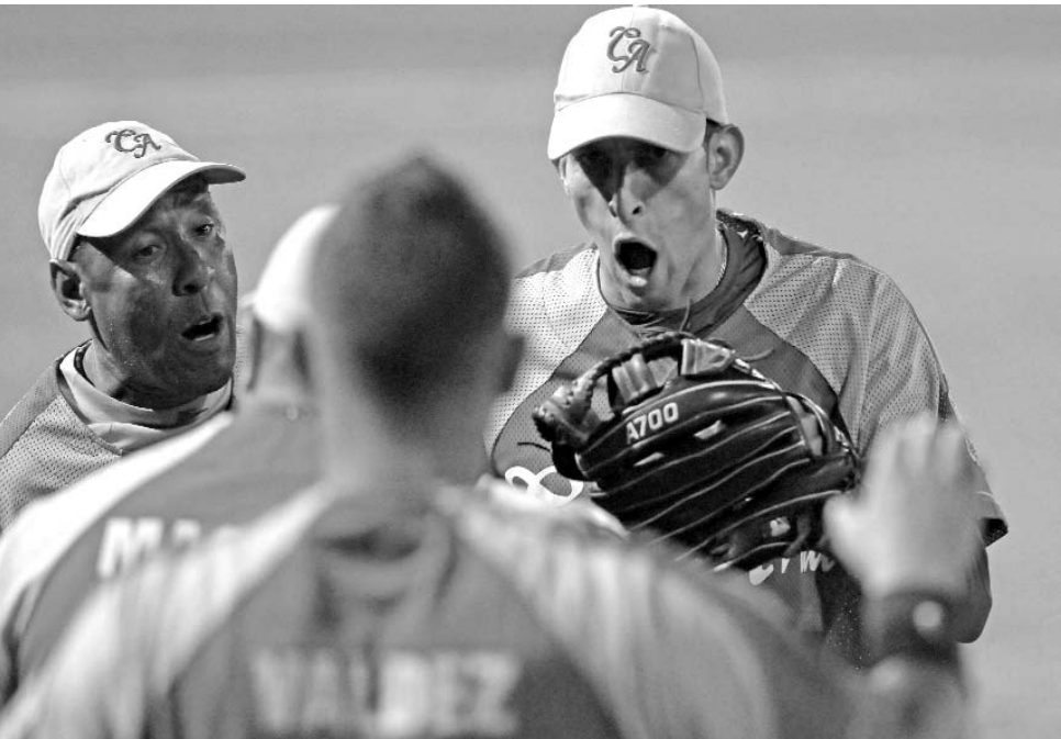
Yander permitió un solo jit.