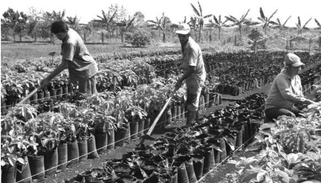
Resuelto el problema de la turbina, queda ahora trabajar fuerte para recuperar la producción en el vivero de frutales.