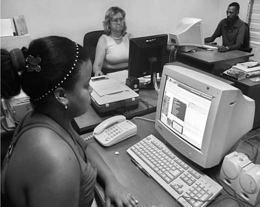
Área de supervisión provincial, escenario para el control del trabajo en la base.

Hasta el momento ese colectivo de cinco integrantes (todos graduados de nivel superior y con amplia experiencia informática o en la explotación del transporte) ha adiestrado a 197 técnicos y 60