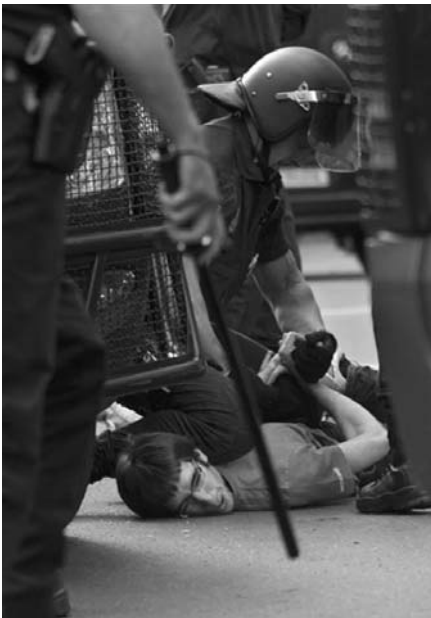
Varias personas fueron detenidas en Madrid y Barcelona durante la huelga de educación.