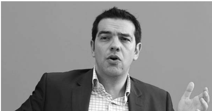
Alexis Tsipras durante la conferencia de prensa.

BERLIN, 22 de mayo.—Alexis Tsipras, el líder de la Coalición de Izquierda Radical griega, advirtió hoy en Alemania que “la medicina no funcionó con Atenas” y precisó que “si el paciente griego no es curado habrá un contagio de la enfermedad a otros países europeos”.