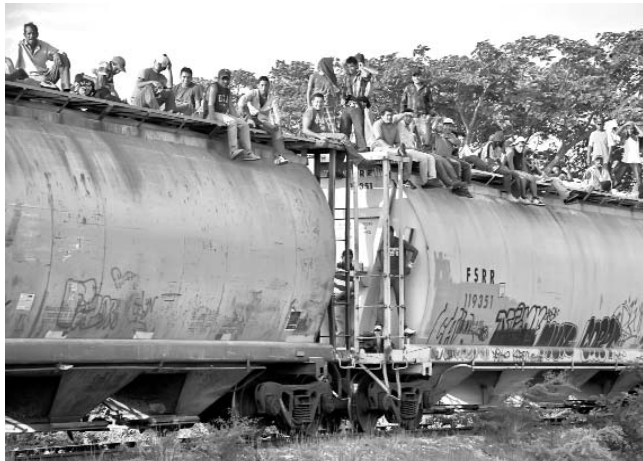
Muchos de los emigrantes centroamericanos viajan sobre el techo de los trenes de carga.

La mantuvieron retenida y la obligaron a trabajar de cocinera en una hacienda en el estado de Tamaulipas, donde se encontraban otros secuestrados. Finalmente logró escapar de allí gracias a que uno de los custodios se enamoró de ella y se lo permitió. Sin embargo, su suerte fue mucho mejor que la de otros 72 emigrantes centroamericanos, quienes el año pasado, en un rancho de ese mismo esta-