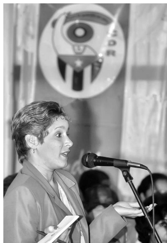
Los jóvenes deben incrementar la participación activa en la dirección de los CDR.

Ahora urge potenciar el papel protagonista que le corresponde desempeñar a los CDR en la vigilancia revolucionaria como tarea fundamental de la organización. Esa es nuestra responsabilidad, insistió.