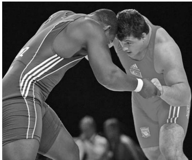
Cara a cara ambos gladiadores extraclase durante el pleito decisivo.