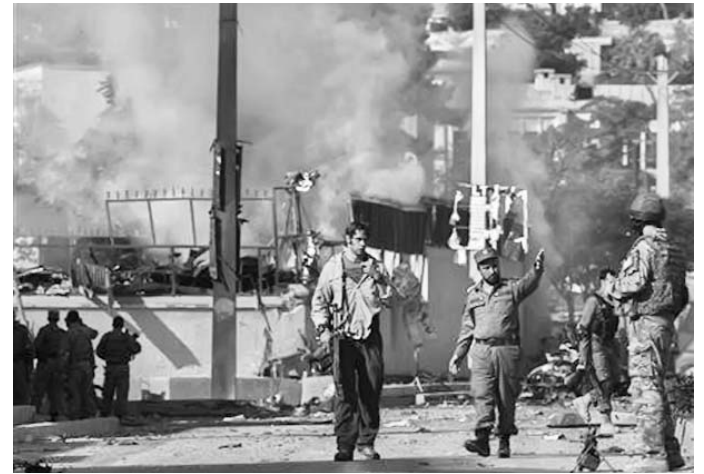
Más de una decena de explosiones resonaron en el lujoso distrito diplomático capitalino.

Estados Unidos ha tenido desde hace mucho tiempo una de los índices más altos de pobreza en el mundo desarrollado. Entre los 24 países examinados por la Organización para la Cooperación y el Desarrollo Económico, solamente Chile, Israel y México tienen tasas más altas de pobreza.