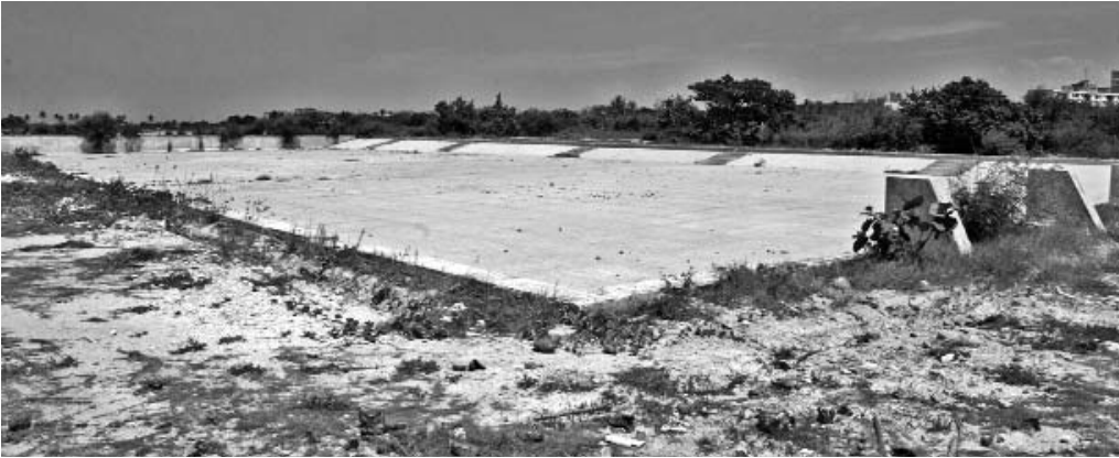
Estos son los restos de la que fuera una vez la Piscina Gigante.

Distintos recintos en la localidad de Alamar pudieran servir como espacios recreativos para la población, pero hoy se encuentran faltos de atención o totalmente abandonados. Este pudiera ser un ejemplo de lo que tal vez ocurre en otros territorios del país