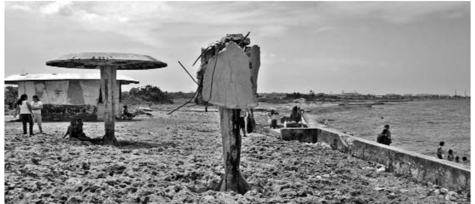
La Playita de los Rusos está en total abandono.