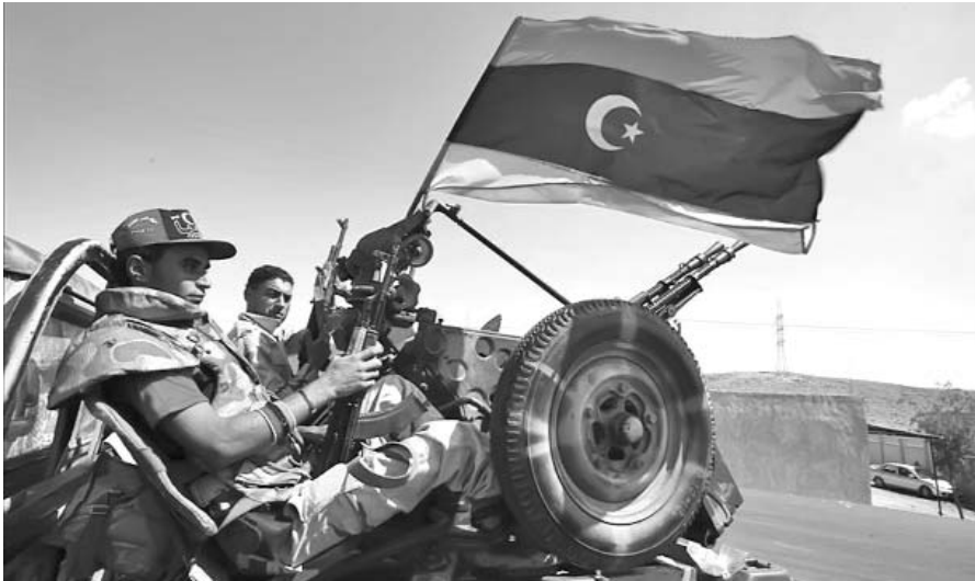
Las diferencias entre los opositores por monopolizar el gobierno se evidencian cada día más.

El número de personas centenarias en Japón alcanzó el récord de 47 756, lo que supone un incremento de más de 3 000 personas con 100 años o más respecto a las cifras de hace un año, y cuatro veces más que 12 años atrás. El 87,1 % de ellos son mujeres. Con una población de 128 millones de personas, es uno de los países donde el crecimiento de la cifra de ancianos es más rápido. Cuenta con unos índices de natalidad muy bajos y, en cambio, con una de las esperanzas de vida más altas del mundo. (AP)