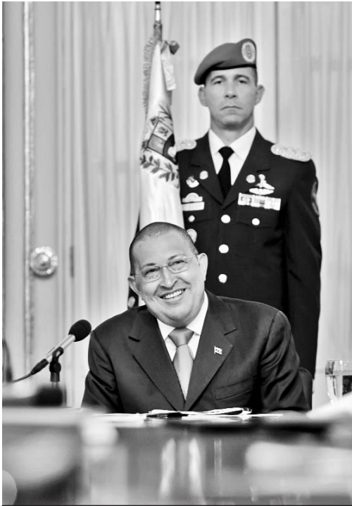
El mandatario durante el Consejo de Ministros de este lunes.

Al reiterarles el respaldo total del Gobierno, los llamó a intensificar el trabajo social, en las escuelas y medios de comunicación para lograr la “transformación definitiva del modelo capitalista, excluyente y egoísta”.