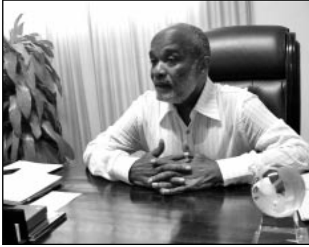
René Preval, presidente de Haití, envía un afectuoso saludo al pueblo de Cuba.

"Cuba ha formado más de 500 médicos haitianos, y no estamos lejos de tener en los próximos días 1 500 cooperantes sanitarios cubanos trabajando en las zonas más recónditas de mi país, en una lucha sin cuartel contra la epidemia de cólera. Es la ayuda más significativa, más efectiva y la más eficaz que hemos recibido.