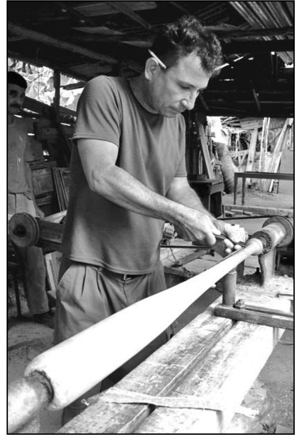
Salgacero fabrica sus propios bates... y dona buena parte de ellos.