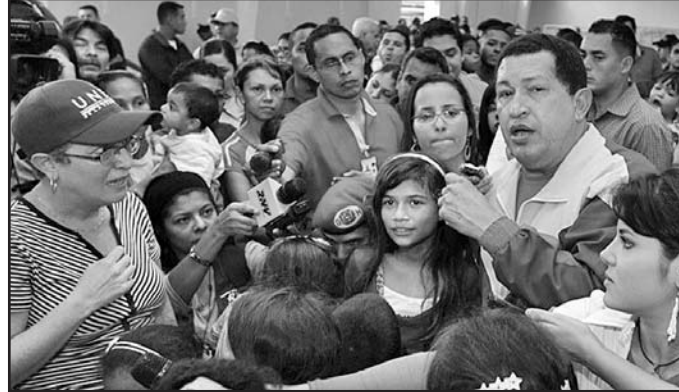
El Jefe de Estado expresó sentirse orgulloso ante el compromiso del pueblo con la Revolución Bolivariana.

habitual espacio dominical las Líneas de Chávez, denominado Feliz año 2011, donde subrayó que los desastres “han venido a advertir que una Revolución solo logra instaurarse como satisfacción de una necesidad histórica, si un pueblo la hace y la siente suya”, agrega PL.