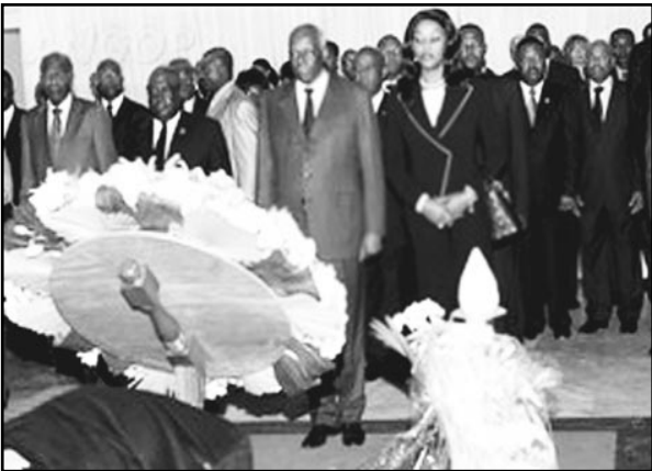
El Presidente angolano rindió tributo a Paulo Teixeira Jorge.