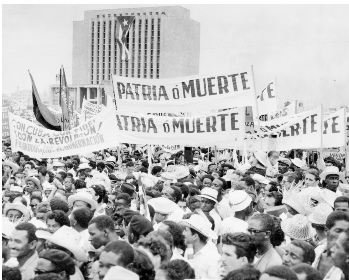
La consigna de Patria o Muerte enarbolada por el pueblo en el año 1960.