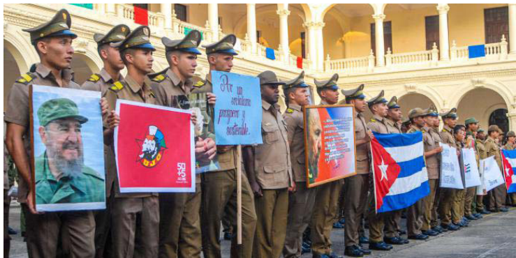
El itm mereció la bandera Proeza Laboral en reconocimiento por sus labores para restaurar los daños del huracán Irma en el territorio nacional.

Saneamiento, recogida de desechos sólidos y escombros, así como la poda de árboles, fueron solo algunas de las acciones protagonizadas por el itm, las cuales dejaron una