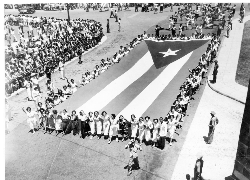
La bandera cubana, la más bella que existe.