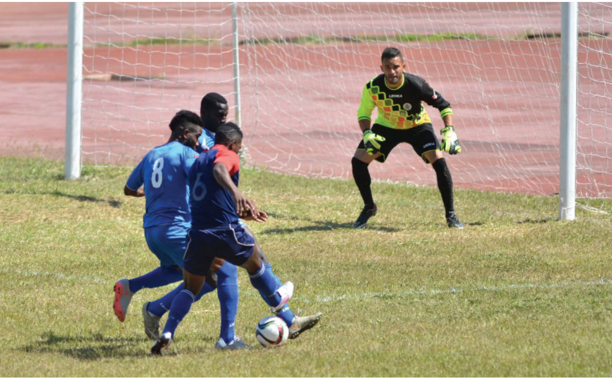
El Campeonato Nacional de fútbol se extenderá hasta el 30 de junio.