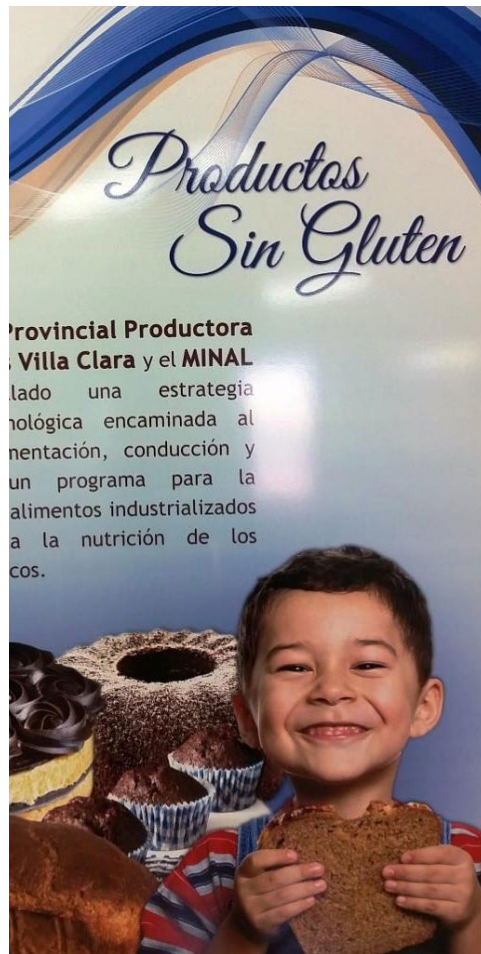
Los precios de los productos resultan muy asequibles.

No sé qué hubiera sido de nosotros sin esta dieta, que para el niño es medicina, expresa la madre agradecida, y pondera la calidad de los productos