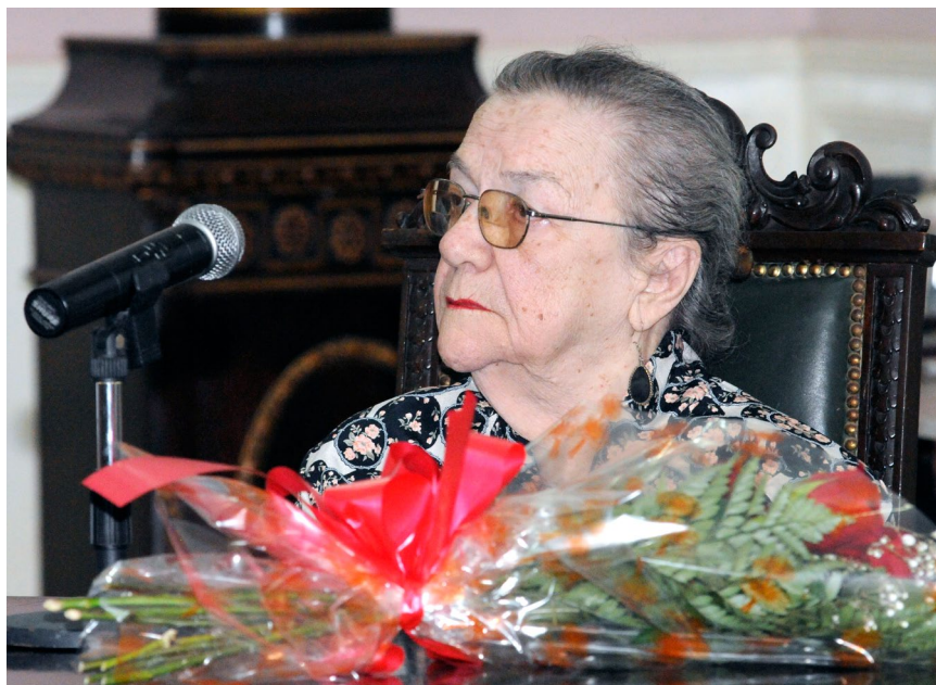
El pasado diciembre la doctora Adelaida de Juan fue distinguida con el Premio Nacional de Enseñanza Artística.

También fue muy apreciada su labor como asesora del Consejo Nacional de Artes Plásticas, el Centro de Estudios del Caribe de la Casa de las Américas y su pertenencia al Consejo Artístico del Museo Nacional de Bellas Artes y su participación con textos publicados en la revista Artecubano y el tabloide Noticias de Artecubano . A nivel internacional destacó su labor como experta de arte latinoamericano de la Unesco.