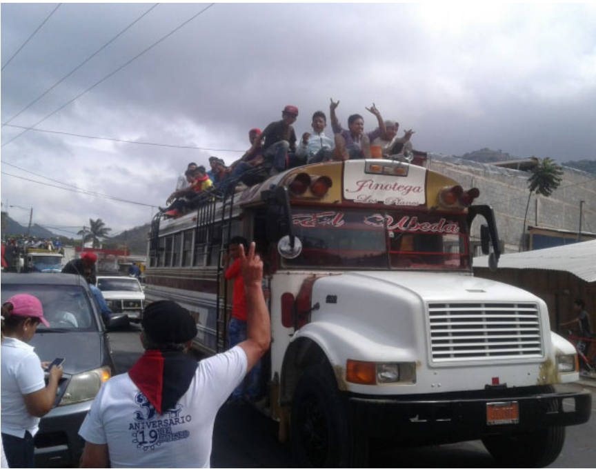
Miles de personas de todo el país se movilizaron hasta Managua, para participar en la manifestación a favor de la paz.

A pesar de que las autoridades dieron marcha atrás a la reforma del