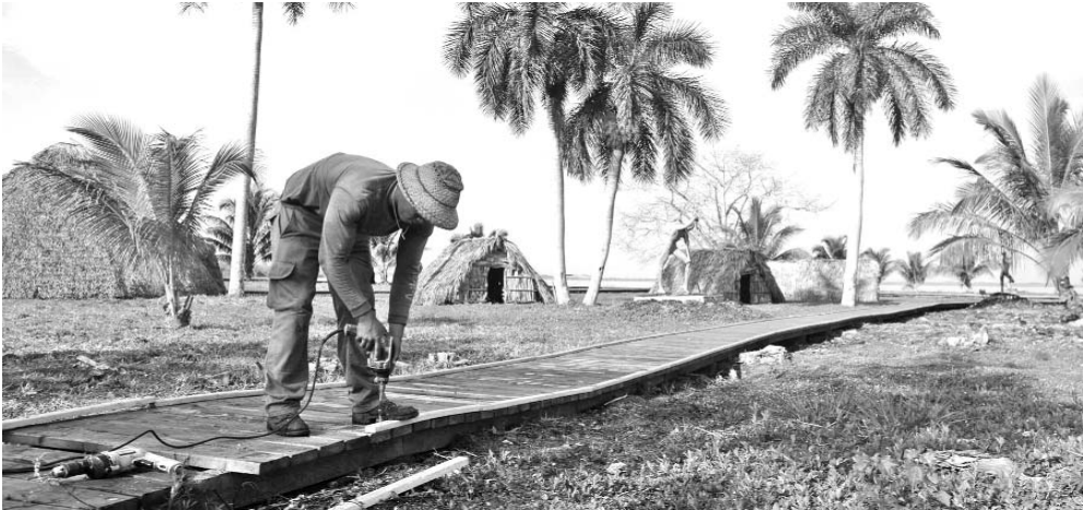
Luego de ocho meses de acciones de restauración, la Aldea Taína luce mejor semblante.

Otra tarea de gran importancia, lo constituye la eliminación de salideros, faena que arrancó por la calle Mariana Grajales, en el Consejo Popular La Playa, y deberá extenderse progresivamente al resto de la ciudad.