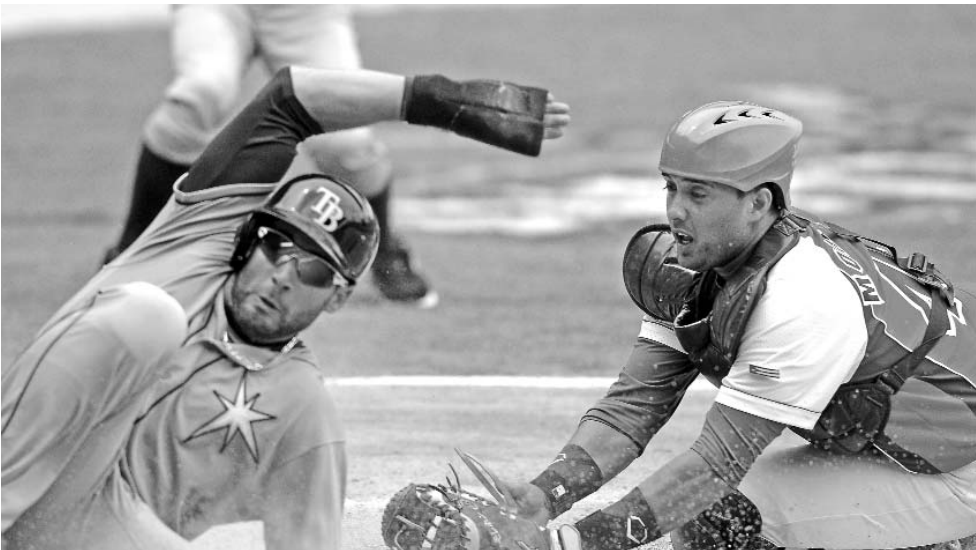
Emotivas jugadas tuvieron lugar en el partido.

que nadie se sienta preocupado, estuvimos en un gran juego y el resumen es positivo. Una vez más se demuestra que perdiendo también se puede enseñar béisbol”, reseñó el mánager cubano Víctor Mesa, quien señaló algunas de las deficiencias que afectaron a su elenco.