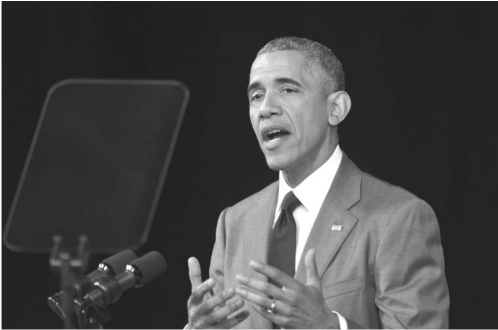
El presidente Barack Obama, demostró su habilidad en el uso del teleprompter.

“A pesar de estas diferencias, el 17 de diciembre del 2014 el presidente Castro y yo anunciamos que Estados Unidos y Cuba comenzarían un proceso de normalizar las relaciones entre ambos países. Desde entonces hemos establecido relaciones diplomáticas, abierto embajadas; hemos comenzado iniciativas para trabajar en salud, en agricultura, en educación, en fuerzas del orden; hemos logrado acuerdos para restaurar vuelos directos y servicios de correo; mayores relaciones comerciales y también mayor capacidad para que los estadounidenses vengan aquí a Cuba. Estos cambios fueron muy bienvenidos, aunque todavía hay aquellos que se oponen a estas políticas. Pero