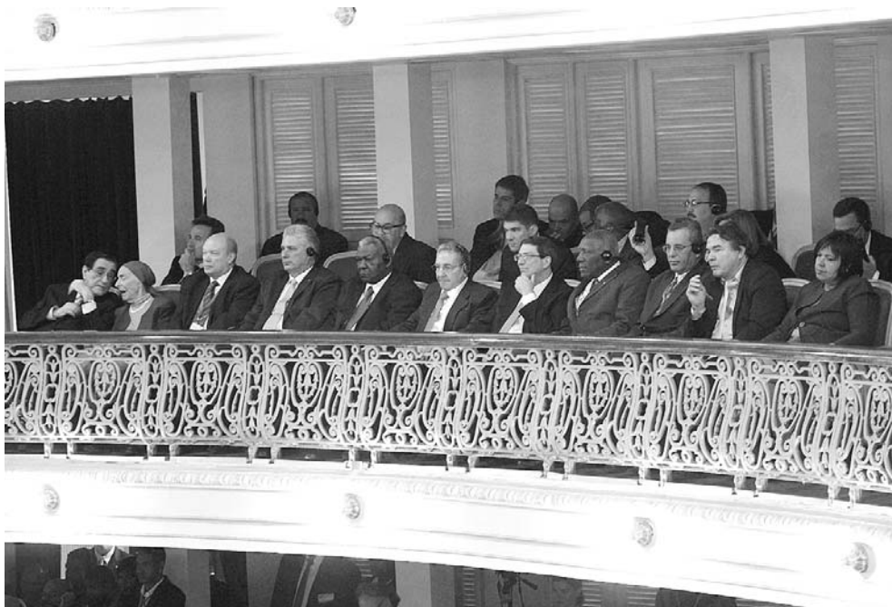
Al Gran Teatro de La Habana Alicia Alonso asistió el General de Ejército Raúl Castro Ruz, acompañado por otros miembros del gobierno cubano.

todavía muchas personas preguntan: ¿Por qué ahora? ¿Y por qué ahora? Y hay una simple respuesta: Lo que estaba haciendo Estados Unidos no funcionaba. Tenemos que tener la valentía de reconocer la verdad: una política de aislamiento diseñada para la guerra fría no tiene sentido en el siglo XXI, el embargo hería a los cubanos en vez de ayudarlos. Y siempre pensé en lo que dijo Martin Luther King: ‘La premura feroz de la hora.’ No tenemos que tener miedo a los cambios, tenemos que acogerlos”, manifestó.