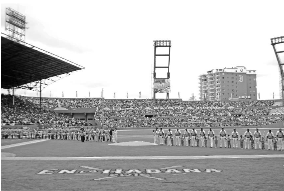
Una entusiasta afición desbordó el estadio Latinoamericano en la tarde de ayer. FOTOS: RICARDO LÓPEZ HEVIA

El estadio Latinoamericano vivió una fiesta con el partido de pelota entre los equipos Tampa Bay Rays y la selección cubana, presenciado por los presidentes de Cuba y Estados Unidos