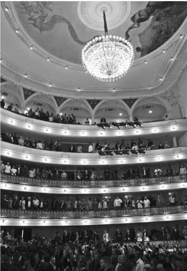
Más de mil personas, de la más amplia representación de la sociedad cubana actual, estuvieron presentes en el discurso de Obama.

El representante demócrata por Massachusetts, James McGovern, quien viene defendiendo esta causa hace muchos años, dijo a Granma que le daba créditos a ambos presidentes