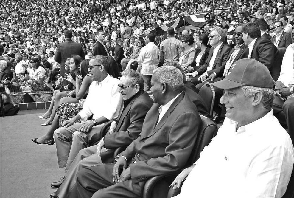
Los presidentes Raúl Castro Ruz y Barack Obama presidieron la velada beisbolera.